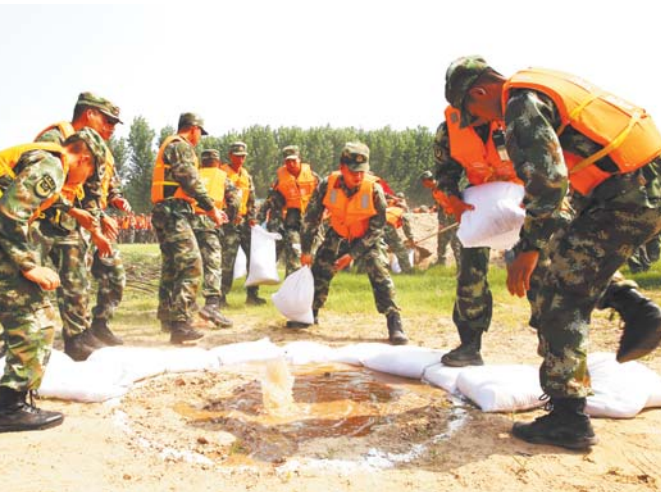
□记者 王世翔 通讯员 周广学 报道 近日, 东营市油地军8支队队伍400余人在利津县崔家控导工程进行黄河防汛联合演习。

□记者 周艳 报道 本报济南7月15日讯 据省气象台预报, 15日白天到夜间, 鲁东南和鲁中地区有大到暴雨局部大暴雨, 鲁西北地区有雷雨或阵雨, 其他地区有中到大雨局部暴雨。鉴于降雨预报区近期降雨量超过100毫米, 根据《山东省防汛预警暂行办法》, 省防总决定7月15日8时启动防汛Ⅳ级预警。要求各级各有关单位要根据职责分工, 迅速落实相关防范措施, 确保人民群众生命财产安全。