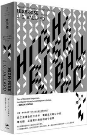
《摩天楼》 【英】J.G.巴拉德 著 上海人民出版社

有一座垂直的小城，穷人住在昏暗局促的最底层，中产阶级住在中层，富人住在奢侈豪华的最上层，他们彼此相安无事地度过了短暂的和谐时光。然而这种被达尔文主义者视为合理的社区结构，很快就遭到了破坏。