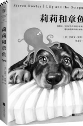
《莉莉和章鱼》 【美】史蒂文·罗利 著 江苏凤凰文艺出版社

作为一个极其短暂却又不能忽略的朝代——南明，想必很多人都对其抱有一丝的好奇和遗憾。好奇的是它如何仅仅只走过18年历程便分崩离析，遗憾的是，在不缺人、不缺钱甚至不缺好皇帝的情况下，为何只能走过18年？