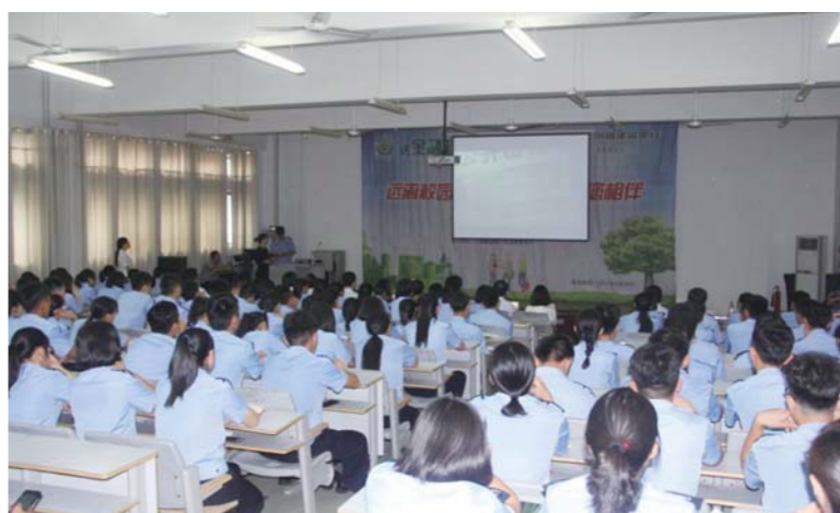
△观看山东银监局金融知识宣传视频

示。首先由建行带来《感到幸福你就拍拍手》工前操表演，展示建行员工的青春活力；随后，学院仪仗队带来《警色青春》表演，展示学院学生的飒爽英姿。第二部分为校园贷宣