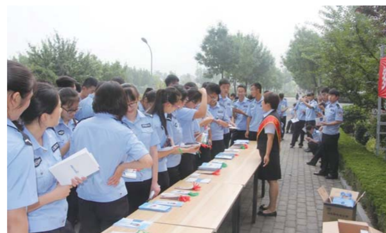
△同学们排队领取宣传材料并聆听宣教志愿者讲解金融知识

室内宣传在山东司法警官职业学院的报告厅进行，设计了视频播放、金融知识宣讲、有奖问答、节目表演、抽奖等多个环节，以提高学生参与的积极性。活动第一部分为风采展