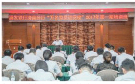
△ “万名党员进党校”第一期培训班