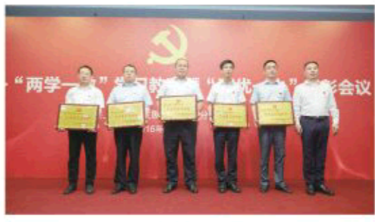
△ “两学一做”暨“两优一先”表彰大会

及廉洁自律各项要求。厉行勤俭节约，反对铺张浪费，规范公务接待，改进文风会风。充分发挥执纪监督职责，加大对大宗物资采购、基建、客户维护、业务交易等重要环节的监督检查，确保各项制度落到实处。