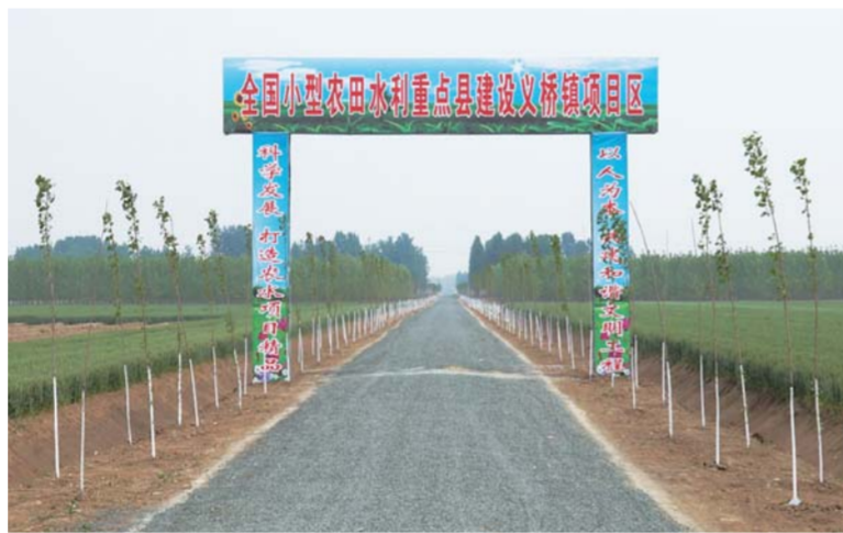
△田间道路拍卖承包增加收入