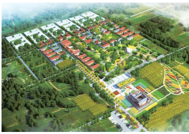
△曹村农村产业融合发展示范园效果图