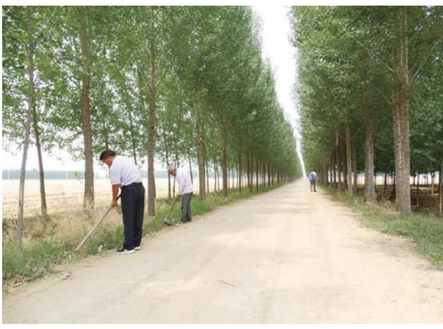
△田间路段栽植树木管护

发展壮大农村集体经济是贯彻落实党的十八大精神的具体体现，是增强农村党组织战斗力、凝聚力的物质基础，是加强基层党组织建设、统筹城乡发展、促进农民增收的有效举措。如今的义桥镇，村级集体经济这块“蛋糕”正在做大，村级组织从“无钱办事”到“有钱办事”，农村基层党组织服务能力增强了，说话办事有了底气和力量，成为带领群众致富奔小康的主心骨、领路人。