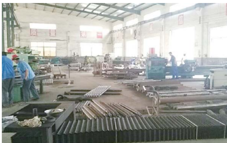
△利用闲置车间发展机械加工