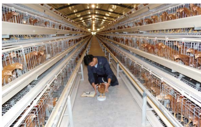
△土地入股创办养殖场