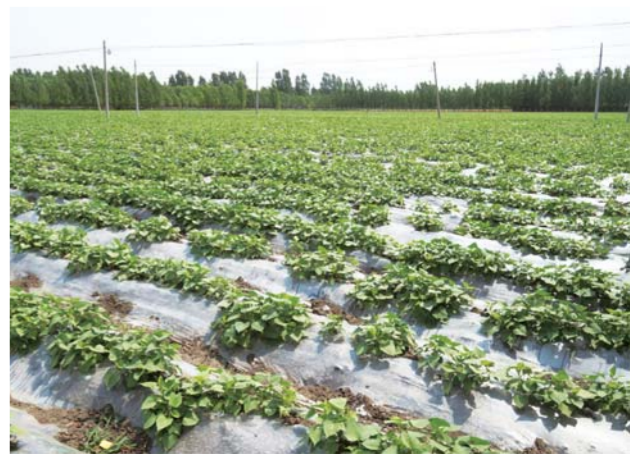
△土地流转发展地瓜种植，收取管理服务费增加收入