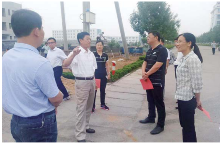
△对标新泰等地学习集体经济