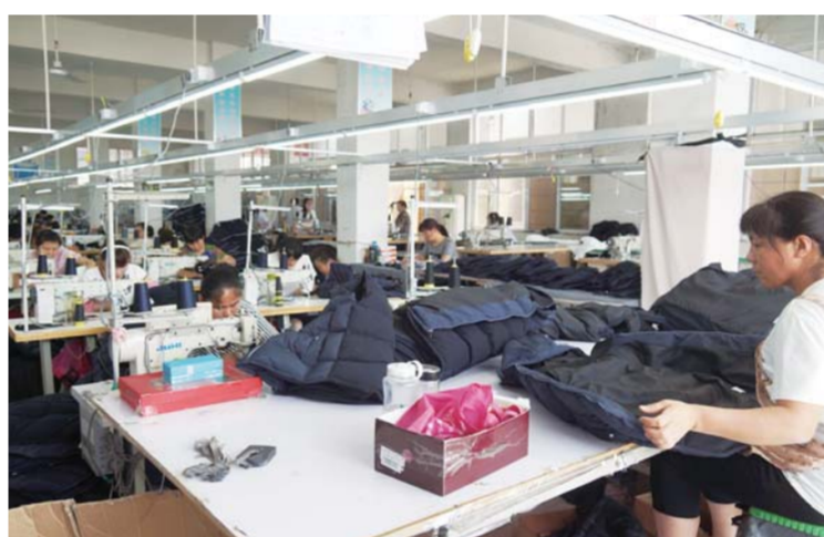
△租赁土地招商引资服装企业生产车间