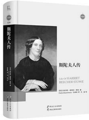
《斯陀夫人传》 【美】查尔斯·爱德华·斯陀 著 黑龙江教育出版社

该书讲述了一个快节奏的悬疑故事，外加一个“高能”结局，为读者带来醉人的阅读体验。14岁的女孩珍娜相信，她人生中最重要的事就是找到妈妈。作者特别擅长细致入微地描绘角色，用优美的文笔创作出引人入胜的故事，直指人心。