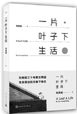
《一片叶子下生活》 刘亮程 著 人民文学出版社

斯陀夫人因《汤姆叔叔的小屋》被世人所知，《斯陀夫人传》是斯陀夫人儿子所著，通过书信、日记的形式全面展现了斯陀夫人的人生、作品、婚姻状况和她所生活的那个时代。