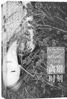
《离别时刻》 【美】朱迪·皮考特 著 人民文学出版社

该书讲述了一个快节奏的悬疑故事，外加一个“高能”结局，为读者带来醉人的阅读体验。14岁的女孩珍娜相信，她人生中最重要的事就是找到妈妈。作者特别擅长细致入微地描绘角色，用优美的文笔创作出引人入胜的故事，直指人心。