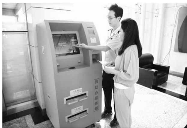
△图为高新地税分局工作人员在指导纳税人使用自助办税终端办理业务

为提高办税效率，让纳税人少跑腿，近期，济南市地税局高新区分局在齐鲁软件园、环保科技园等各大园区、大型商业圈安装了自助办税服务终端，进一步延伸办税服务厅服务功能，为纳税人提供近距离、便捷化服务。（赵明）