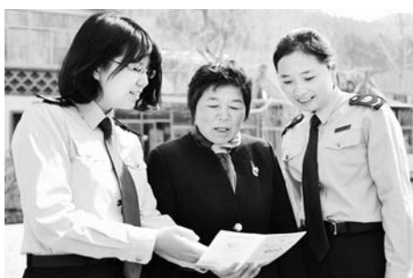
△平阴县地税局组织开展“迎春风、送政策、问需求”活动

而这光鲜的背后，免不了要承受转型的阵痛。据了解，山东兰剑物流科技股份有限公司成立于1993年，2008年开始主做烟草行业的仓储分拣设备，多年来一直保持着全国30%—40%的市场份额，其研发的瀑布式分拣线、密集式储存一体系统等设备遍及安