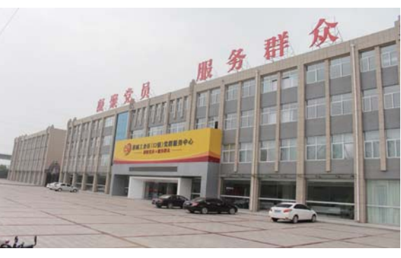
△莱城工业区(口镇)党群服务中心外景

今年4月，口镇党群服务中心迎来了一批远道而来的客人，来自新疆建设兵团、省戏剧家协会的工人演员到莱城工业区口镇党群服务中心参观学习，在参观党群教育基地时，“刘胡兰式的英雄彭秀英”的故事故事在在场每个人、大家通过一个优秀共产党员英勇献身的故事，经受了一次党性的洗礼。故事故事主人公彭秀英是口镇南街村人，在1947年7月，还乡团包围了彭秀英的娘家沾村村，被捕后，敌人用酷刑逼她交出地下党员名单，但是她咬紧牙关一字不说，敌人鞭打了她十五天，仍一无所获，最后将她残忍杀害。那年彭秀英年仅21岁，她用年轻的生命，捍卫自己在党旗下的铮铮誓言。