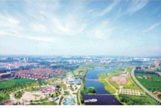
△如诗如画的鸡鸣河国家城市湿地公园

“绿水青山就是金山银山,全域旅游激活县域经济。”莒南县决策者深谙其道。今年以来,莒南抢抓现代旅游发展新机遇,依托丰富的旅游资源,大力实施“全域旅游突破年”活动。天湖飞行乐园暨飞行小镇、通用机场暨通航旅游小镇等一个个旅游项目落地开花,一幅幸福美好新莒南的崭新画卷徐徐展开。