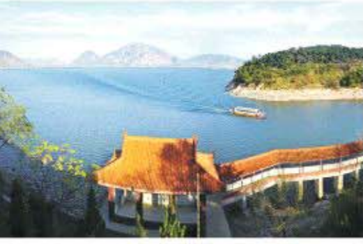
△风光优美的天马岛景区