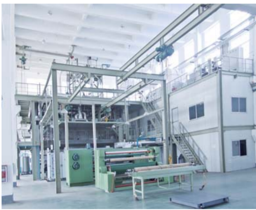
△“新三板”挂牌上市企业泰鹏环保材料股份有限公司高科技无纺布车间