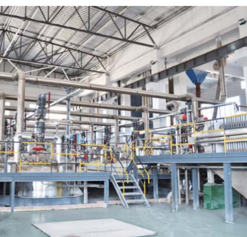
△山东瑞福锂业有限公司生产车间

“两支专业队伍”，提高招商成功率和项目落地率。今年第16届桃花节项目合作洽谈会期间，肥城签约合同项目21个，计划总投资37亿元，其中过亿元项目17个。市领导说：“我们制定统一招商政策，聚焦重点区域、产业、项目、企业，聘请肥