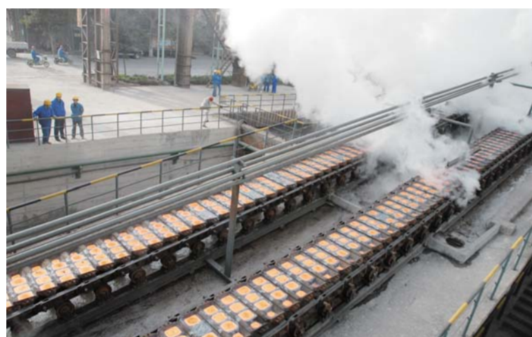
△石横特钢集团有限公司吨钢利润创全国第一