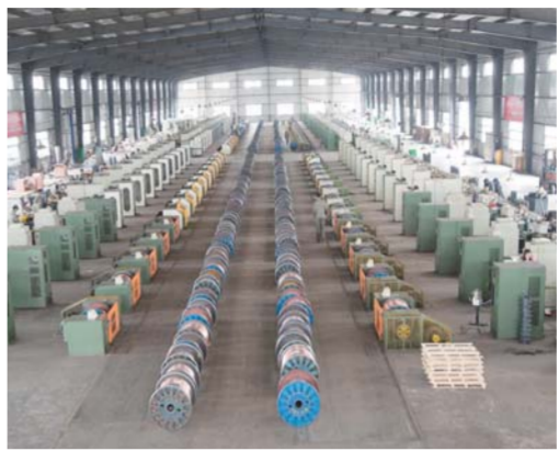
△“新三板”挂牌上市企业索力得焊材股份有限公司是高科技特种焊丝行业龙头