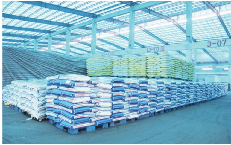
△山东农大肥业科技有限公司拥有4个国家级科研平台、80余项专利