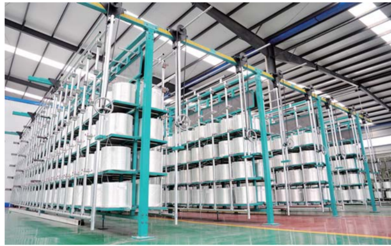
△联谊玻纤格栅生产车间

肥城在“2016年度中国最具投资潜力中小城市百强县市”排名中，位列第16位，全省第二位，成为名副其实的投资洼地、招商磁极。肥城坚持把招商引资和对上争取作为集聚资源要素、推动跨越发展最便捷、最有效的途径，实施精准招商。组建招商谈判和项目落地