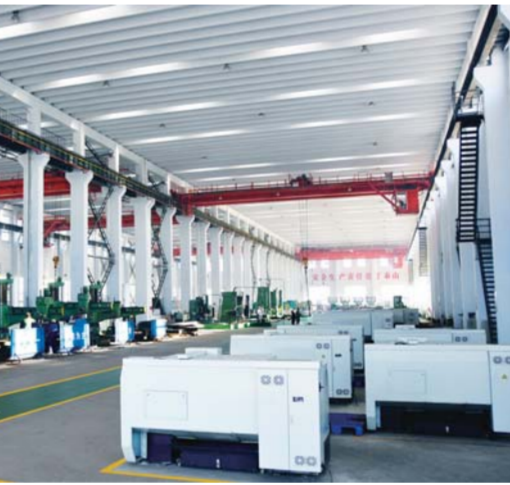
△金塔机械有限公司参与制定了酒精蒸馏塔行业国家标准

城在外人才担任招商顾问，提高招商精准度和辐射力。”强化对上争取。成立市经济协作办公室，研究梳理工业、农业、服务业、企业培植、棚户区改造等12项89条具体扶持政策，精准策划包装推介项目。今年以来，梳理重点对接项目