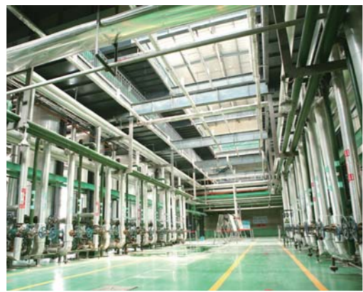
△“新三板”挂牌上市企业一滕新材料股份有限公司纤维生产车