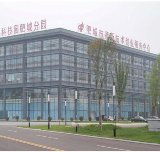
△肥城市高新区研发产业园