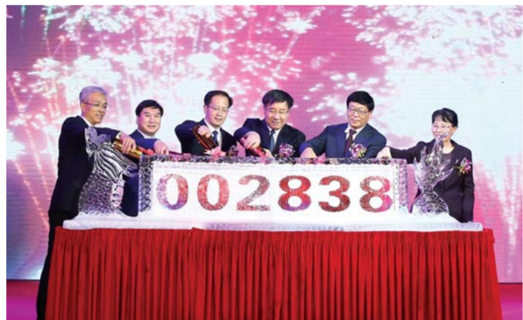
△2017年1月6日，龙口道恩股份在深圳证券交易所挂牌上市