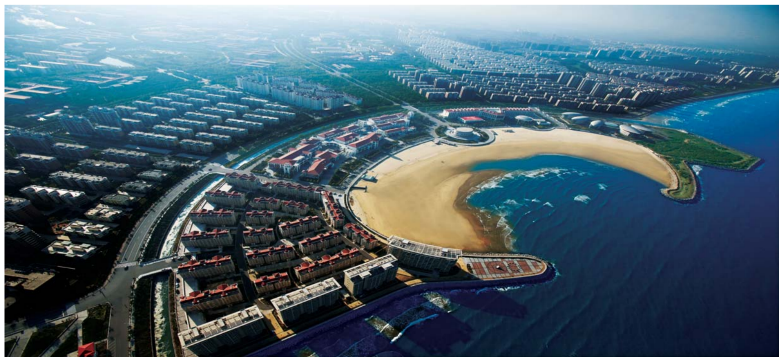
△南山东海园鸟瞰图

用日益凸显。”该市主要负责人说。龙口市作为全省转型升级试点县，近年来，该市密切关注上级改革动向，聚力抓好改革任务落实，推行“常态化、制度化、痕迹化、绩效化”四化融合督导督办模式，全面实施“创新驱动”战略，深化“产学研政”合作，积极鼓励扶持企业到国内外人才聚集的大城市建立研发中心，借助域外高等院校的科研优势和智力资源，就地吸引高层次人才，不断增强企业自主创新能力，形成一大批科技含量高、市场前景广、经济效益好的优秀科技成果，加快了“龙口制造”向“龙口创造”的推进步伐，有利支撑全市经济社会高质量发展。