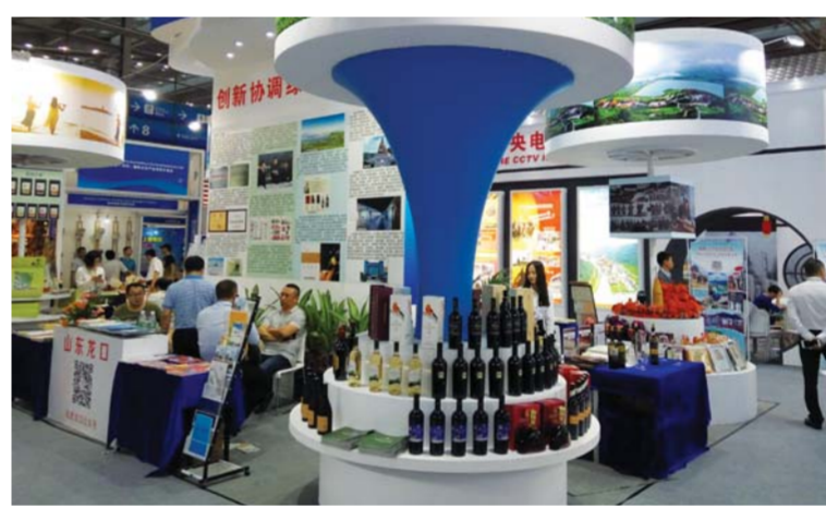
△参加中国(深圳)博览会