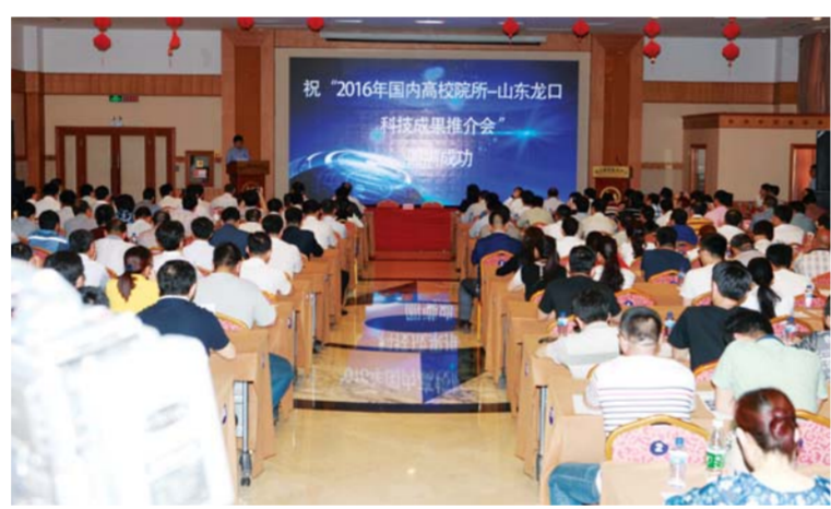
△2016年国内高等院校——山东龙口科技成果推介会现场