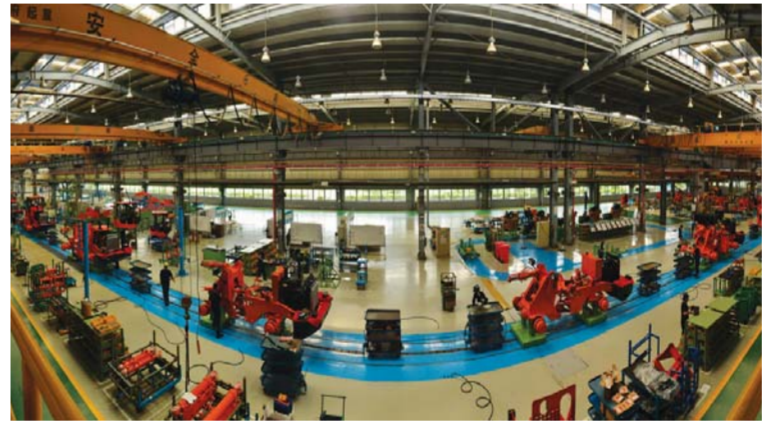
△兴业机械成为国内规模最大的无轨设备生产和创新基地