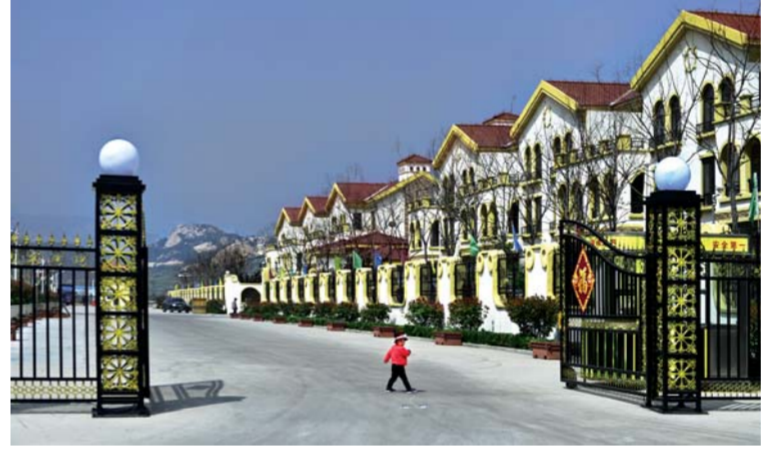
△干净整洁的生态文明示范村