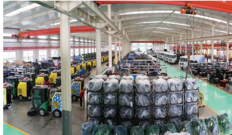
△海德新能源电动商用车现代化生产车间