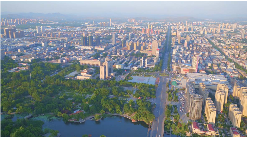
△蓝绿大地上，一座富民强市的新城正在崛起

● 规模以上工业增加值增幅连续几年保持全省前列 1.2016年全市完成地区生产总值年均增长8.7%，实现地方财政收入年均增长6.2%，规模以上工业增加值年均增长10.6%，特别是规模以上工业增加值、外贸出口等指标增幅连续几年保持全省前列。 2.质量效益显著提高，三次产业比由6.7:60.6:32.7调整为7.8:50.2:42.2，非钢产业产值占比由44.3%提高到61%，高新技术产业产值占比