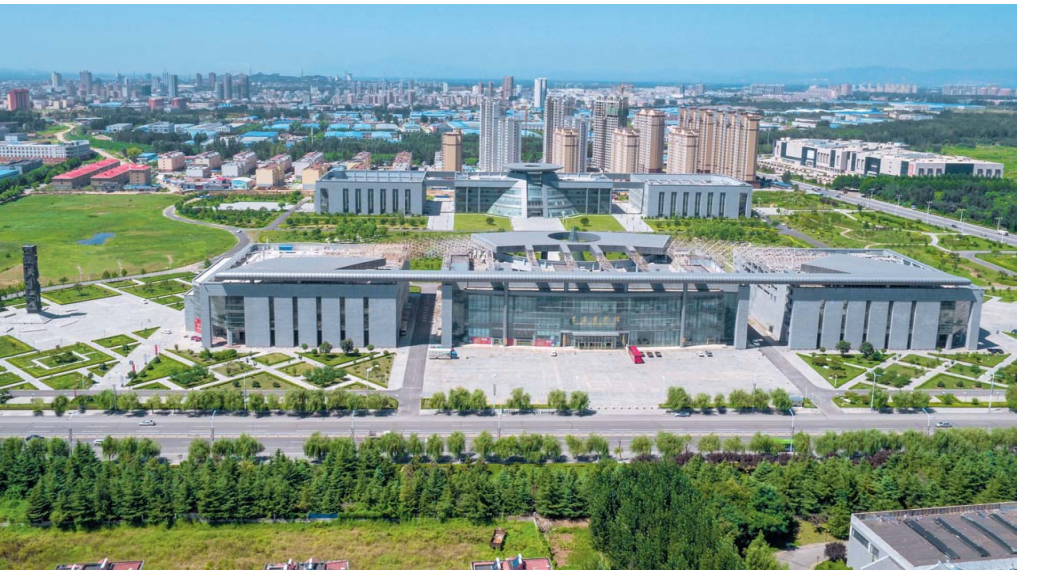
△新建的“六馆一院”，为全市人民展现了莱芜的历史和未来

推进项目建设、招商引资和企业培育，经济发展实现稳中有进、稳中提质、稳中向好。非钢产业产值占比由44.3%提高到61%，“一钢独大”成为历史。 今后五年，是莱芜全面深化改革的攻坚期，是经济社会发展的转型期，更是全面建成小康社会的决胜期。面对发展方式转变、新旧动能转换、劳动力素质能力转型等现实考验，莱芜市将走上依靠创新、依靠科技、依靠人才的发展之路，必定迎来新一轮质量更好、层次更高、效益更优的发展时期。 莱芜市提出，要突出“践行新理念、建设新莱芜”主题，强化全面从严治党核心引领和坚强保证作用，大力实施工业立市、生态建市、创新兴市、质量强市战略，坚持不懈推动转调、深化协作、促进创新、构建和谐，加快建设“实力莱芜”、“活力莱芜”、“魅力莱芜”、“生态莱芜”和“幸福莱芜”，努力在提前全面建成小康社会进程中走在全省前列。