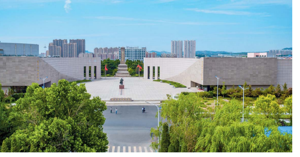
△改造升级后的莱芜战役纪念馆,被评为“全国爱国主义教育示范基地”