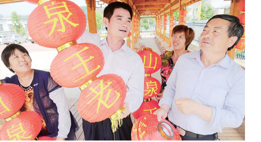
△驻村第一书记帮助雪野旅游区王老村发展农家乐

● 实现基层党建“六个全覆盖” 1.从严从实开展党的群众路线教育实践活动,“三严三实”专题教育,“两学一做”学习教育,深入开展“解放思想,提升境界,争创一流”大讨论,“比干比强比担当,创新创业创新一流”主题竞赛活动,严肃了作风纪律,密切了党群干群关系,推动了干事创业、科学发展。 2.宣传推介了维和英雄杨树朋、“齐鲁时代楷模”王守东、“扶贫攻坚带头人”陈明利等模范榜样,舆论引导和典型宣传能力有了新提升。 3.从严强化干部队伍管理,全面加强领导干部和干部队伍建设,牢牢把握新时期好干部标准,树立了鲜明的选人用人导向,顺利完成换届考察工作,探索开展了市区镇(街道)干部双向交流挂职。 4.从严夯实基层基础,切实强化基层党组织建设,创新推进基层党组织培训、普法、服务、审计、保障,考核“六个全覆盖”。