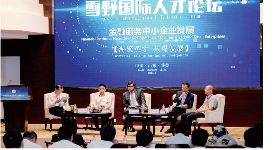
△雪野国际人才论坛成功举办

● 引进和培养高层次人才60余人 引进和培养千人计划,万人计划,泰山系系列人才高层次人才60余人,省级以上创新平台达到60家;全社会研发投入占GDP比重达到2.52%,财政科技支出占全部支出比重达到2.5%,万人拥有有效发明专利6.69件,各类创新指标均居全省前列。 1.全市民生投入占财政支出比重达到73.8%,全市城乡居民人均可支配收入分别达到32364元、14852元,年均分别增长9.06%、10.65%。 2.脱贫攻坚取得明显成效,积极探索十大产业扶贫路径,创新探索“插花型”贫困地区产业脱贫模式,全市4.3万贫困人口实现脱贫,建档立卡贫困人口总数的77.9%。 3.坚持不懈为民办好事,先后完成薄弱学