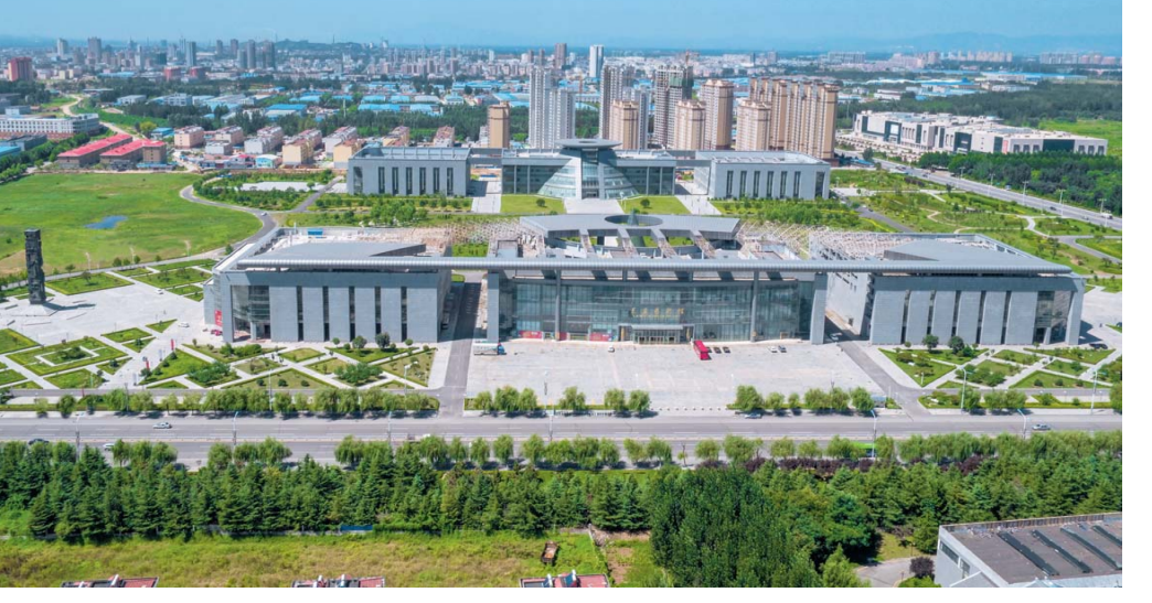
△新建的“六馆一院”,为全市人民展现了莱芜的历史和未来

推进项目建设、招商引资和企业培育,经济发展实现稳中有进、稳中提质、稳中向好。非钢产业产值占比由44.3%提高到61%。“一钢独大”成为历史。 今后五年,是莱芜全面深化改革的攻坚期,是经济社会发展的转型期,更是全面建成小康社会的决胜期。面对发展方式转变、新旧动能转换、劳动力素质能力转型等现实考验,莱芜市将走上依靠创新、依靠科技、依靠人才的发展之路,必定迎来新一轮质量更好、层次更高、效益更优的发展时期。 莱芜市提出,要突出“践行新理念、建设新莱芜”主题,强化全面从严治党核心引领和坚强保证作用,大力实施工业立市、生态建市、创新兴市、质量强市战略,坚持不懈推动转调、深化协作、促进创新、构建和谐,加快建设“实力莱芜”、“活力莱芜”、“魅力莱芜”、“生态莱芜”和“幸福莱芜”,努力在提前全面建成小康社会进程中走在全省前列。