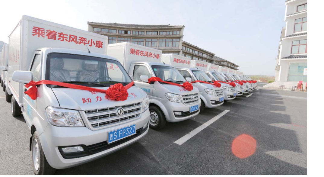
△“扶贫大连车”是莱芜市钢城区探索庭院扶贫项目的创新之举,打通了产销对接“最后一公里”

● 在全省率先建立城乡一体的居民养老和医疗保险制度 1.全市民生投入占财政支出比重达到73.8%,全市城乡居民人均可支配收入分别达到32364元、14852元,年均分别增长9.06%、10.65%。 2.脱贫攻坚取得明显成效,积极探索十大产业扶贫路径,创新探索“插花型”贫困地区产业脱贫模式,全市4.3万贫困人口实现脱贫,建档立卡贫困人口总数的77.9%。 3.坚持不懈为民办好事,先后完成薄弱学