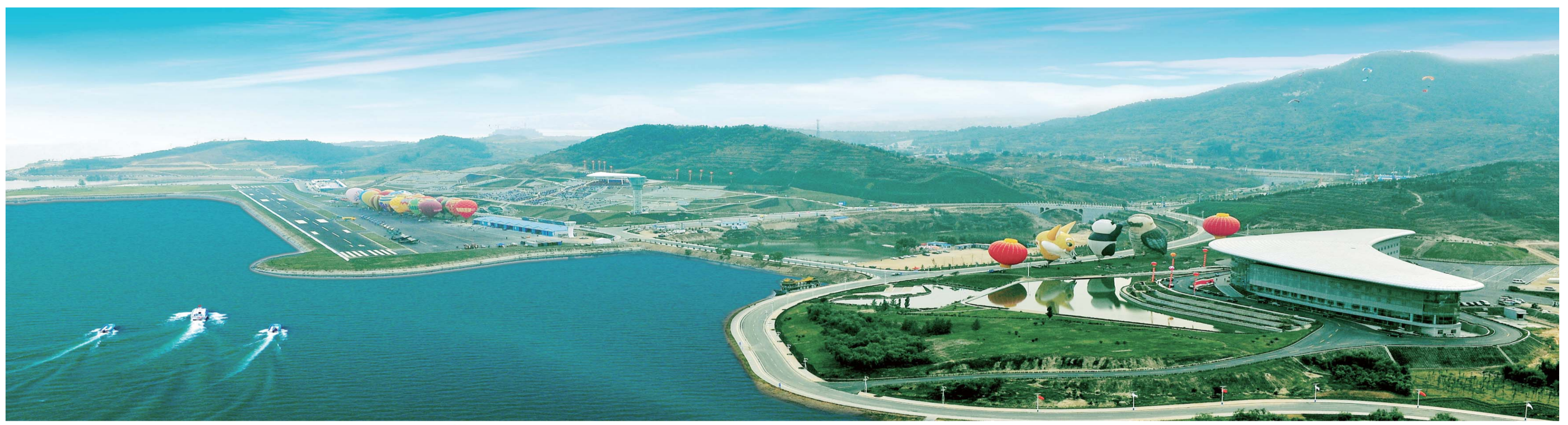
△山清水秀的雪野成为中国国际航空体育节永久举办地