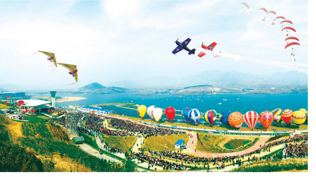
△中国国际航空体育节每两年在莱芜雪野旅游区举办

成绩的取得来之不易。过去五年来,莱芜市面对前所未有的严峻复杂形势和经济发展新常态带来的挑战,加快新旧动能转换,贯彻落实稳中求进的工作总基调,周密谋划,积极应对,建立并强化了稳增长调结构促发展重点工作指挥协调机制,制定出台了一系列切实可行的政策措施,扎实开展开展引领创新发展的“七项竞赛”,大力推动十大产业振兴提升,持续