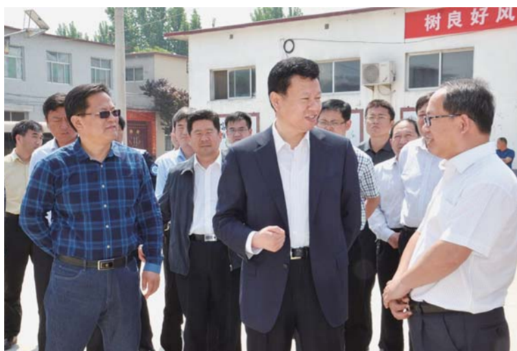
△长清区委区政府领导到街镇督导环境整治