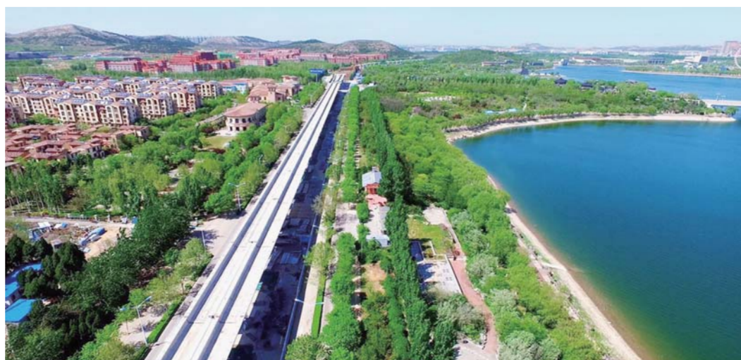
△正在建设中的轻轨R1线