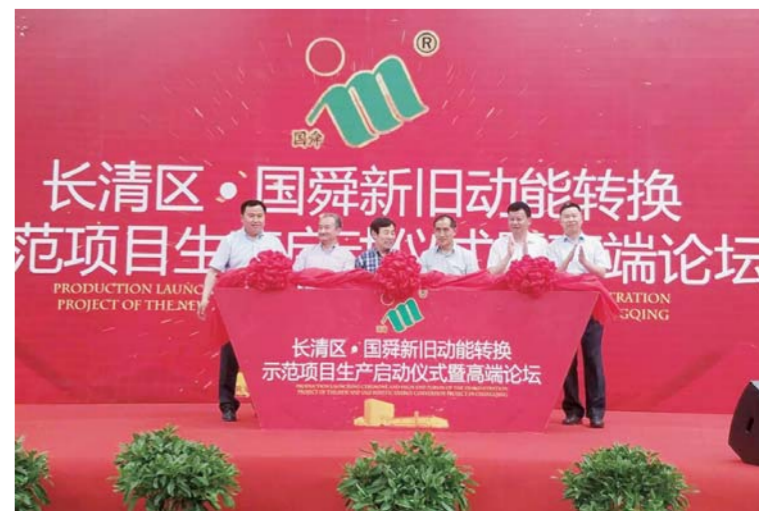
△长清区·国舜新旧动能转换示范项目生产启动仪式暨高端论坛