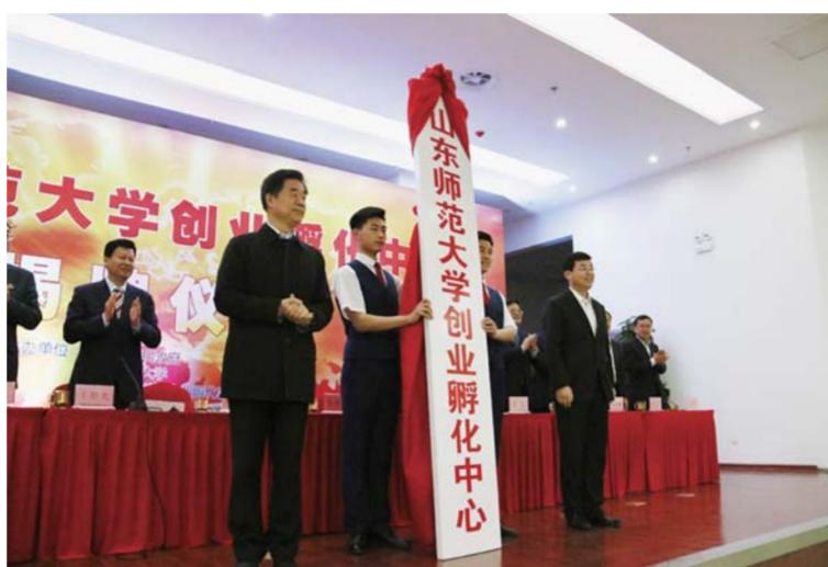
△山师创业孵化中心揭牌

短短开局4个月，济南市长清区创新创业热潮涌动，新经济茁壮成长，新动能加快积蓄。“要以新发展理念为引领，瞄准‘痛点’破难题、补短板、延链条，以扩大有效供给实现‘动能转换’，把解决影响长清发展和群众反映强烈的突出问题，作为加快长清发展的着力点和创新点，实现跨越发展。”区委领导说。