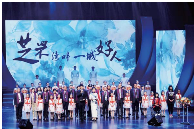
△芝罘区道德模范颁奖典礼