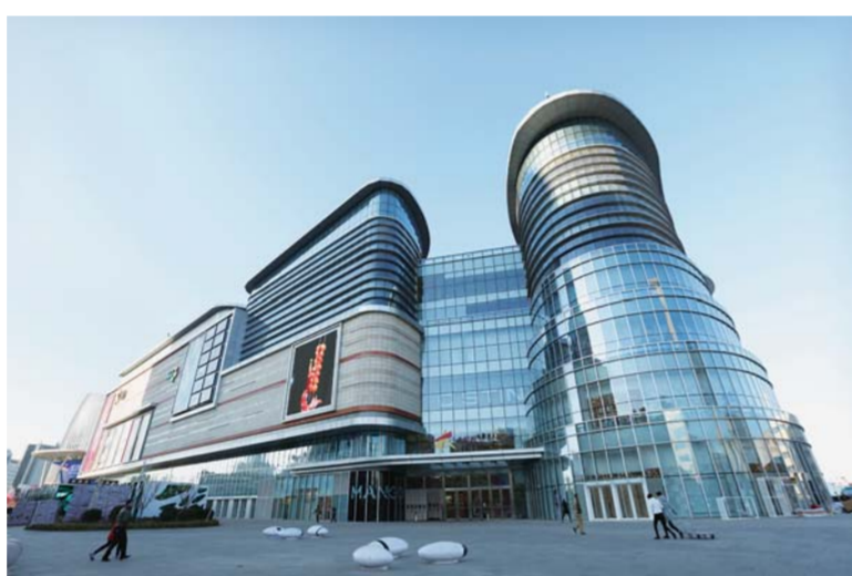
△烟台首个临海商业综合体大悦城