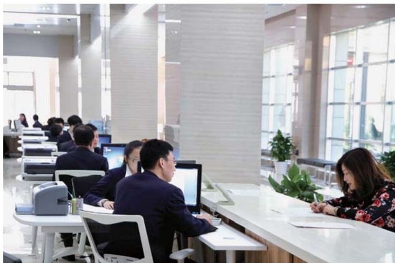
△“一柜通”实现“一窗受理、一柜办结”

五年来，芝罘区域经济增长发展，各项事业呈现一派繁荣的生动景象。未来五年，芝罘区将紧紧围绕“坚定一个目标，强化一个保障，打赢两个攻坚战，加速两个崛起”的总要求，着力建设实力芝罘、活力芝罘、魅力芝罘、和谐芝罘，努力推动烟台“首善之区”建设向更高层次、更高水平迈进！