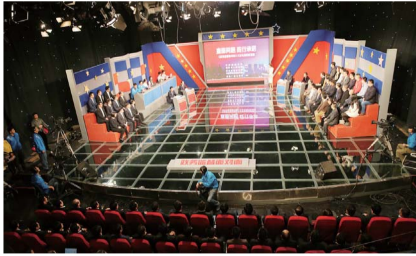
△济南电视网改“提速增效”