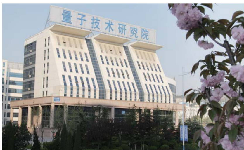
△未来济南将重点发展量子通信产业