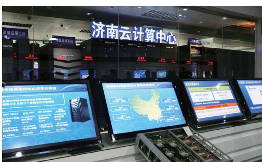
△济南云计算中心发力大数据产业