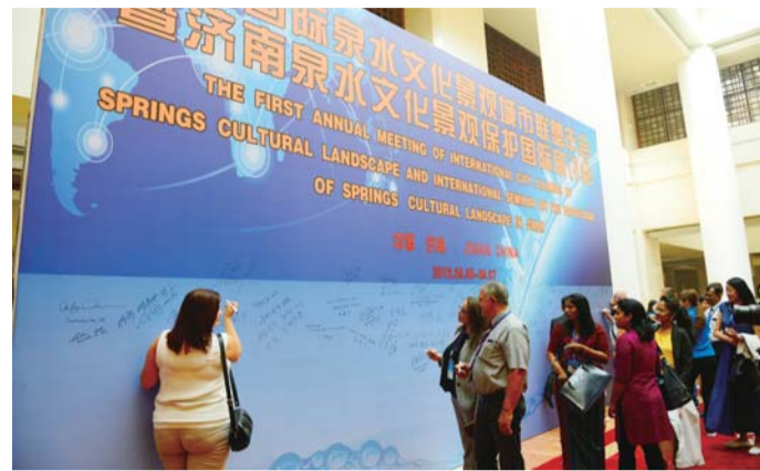
△泉水国际联盟：让泉城走向世界

“让实干者实惠”的激励机制与“为担当者担当”的保障机制两者相辅相成，共同构成一个完整的促进干部“想干事、敢干事”的制度体系。