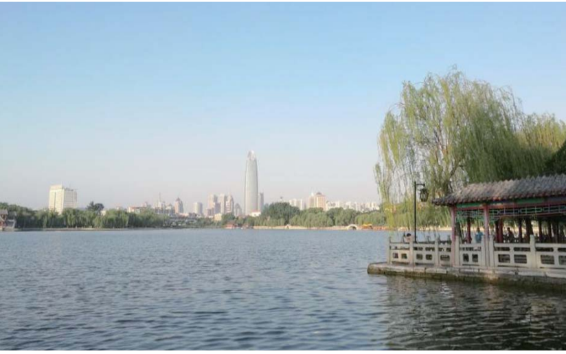
△济南奥体文博片区