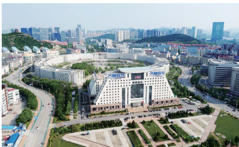
△齐鲁软件园：济南信息产业之核

“济南市此次改革的一大亮点就是对南部山区创新考核体系，即建立以生态保护为主导的绩效评价考核体系。”