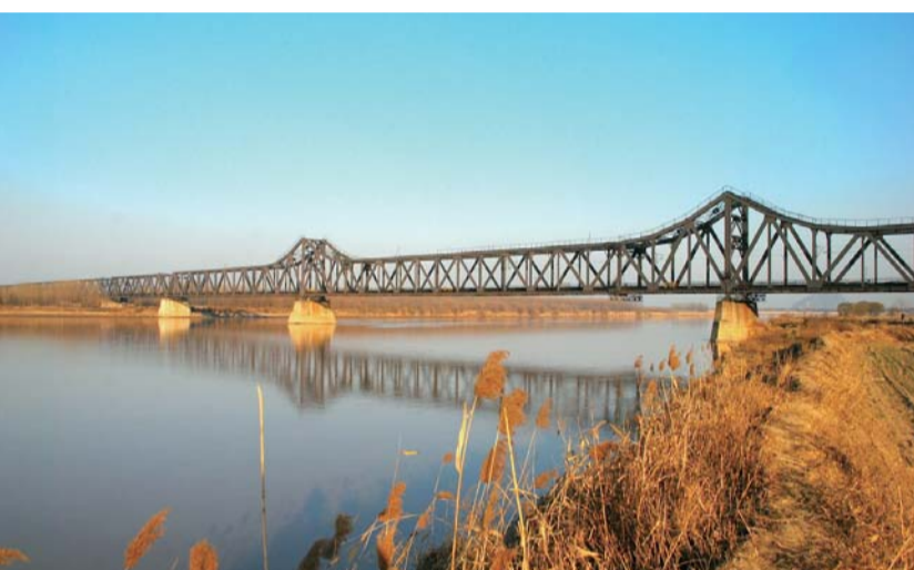
△黄河大桥，拓展空间，携河发展决定济南的未来