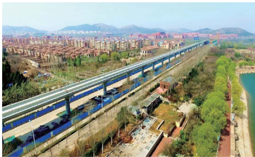
△济南正在建设中的轻轨R1线