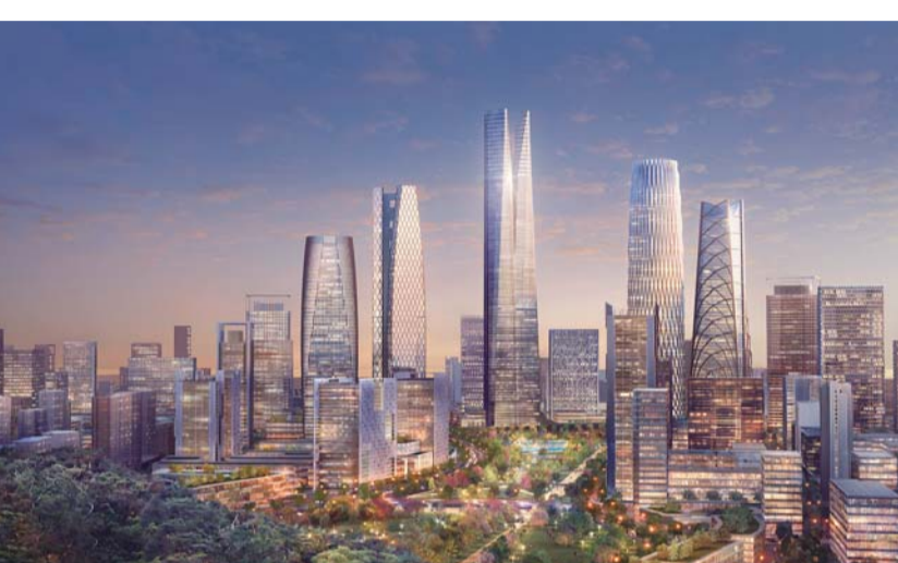
△济南CBD城市设计：“齐鲁新海拔，泉城真活力”