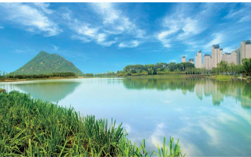
△大明湖畔眺望济南“第一高”