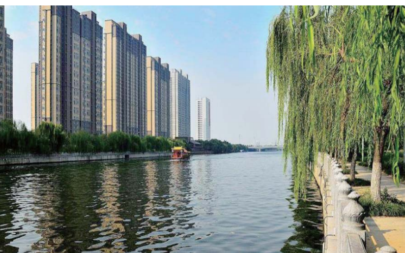
△小清河景观带，发展带正在隆起