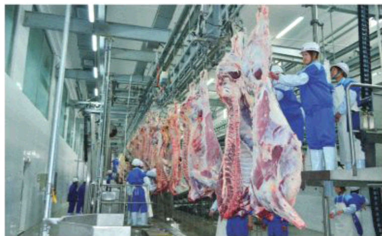
△鸿安集团——具有国际领先水平肉牛屠宰加工生产线

以提高宜居性为落脚点,推动老城、新城、开发区“三区”共建,完善功能,丰富内涵。绿伴行、赏花赏、水提神、景怡人,一座