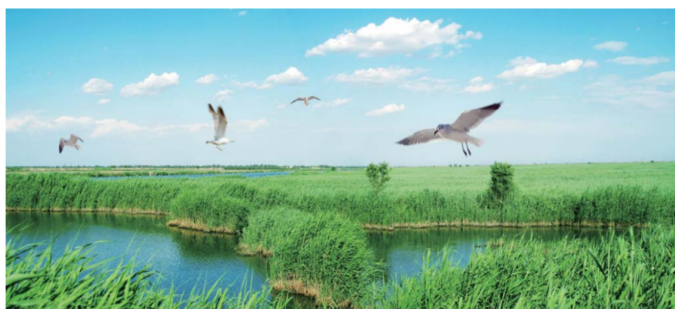
△黄河水乡国家湿地公园——山东省首批重点保护湿地