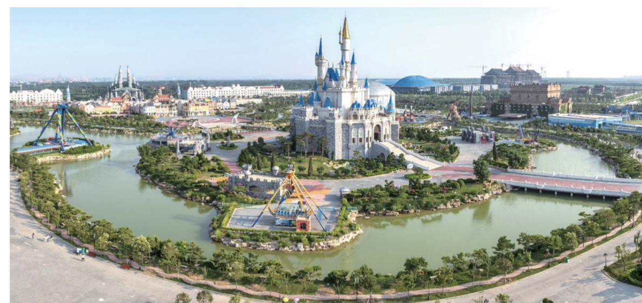
△泉城欧乐堡梦幻世界——全国设备先进、功能完善的主题乐园