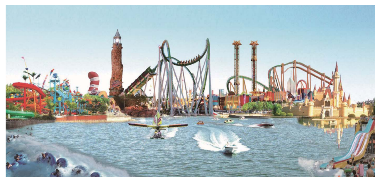
△水上世界——国内首个具有国际标准的水上乐园