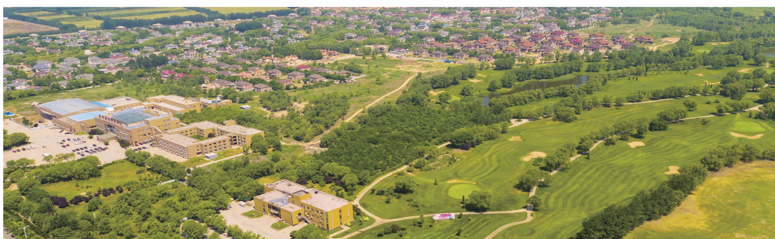
△齐河温泉小镇——打造全国一流的“产城融合”示范温泉小镇