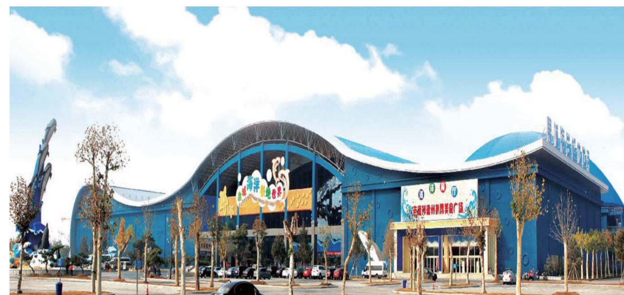
△泉城海洋极地世界——亚洲规模最大的单体室内海洋馆