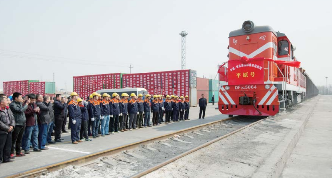
△海铁联运集装箱班列