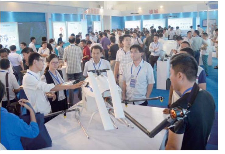
2016年9月22日，中国—德州首届京津冀鲁技术交易大会上，德州农用机器人技术有限公司生产的植保无人喷雾机吸引了众多客商参观洽谈。

德州传统产业占到75%左右，去年平板玻璃、水泥、炼铁等过剩产能化解率达到79.16%。关停工业企业139家，淘汰落后生产线12台(套)，超额完成省下达的化解过剩产能任务，严厉打击制造“地条钢”等违法行为。落实“三去一降一补”任务，在此基础上，“去、降”工作基础上，今年主要突出“补”，重点补上新动能不足这一短板。培育壮大新动能和节能环保、智能装备制造、生物技术等六大千亿级战略性新兴产业集群，拉长做强产业链条。特别是以北汽、奇瑞、联手、丽驰等为代表的新能源汽车项目布局德州，产业集群已颇具规模。在去年德州组建新能源汽车、新材料等12个产业联盟的基础上，今年将再组建7个市级产业技术创新联盟，巩固区域内的产业联系。2018年，第二届中国国际太阳能十项全能竞赛将在德州市举办，今年将举办选拔赛，位于德州经开区的比赛场太阳能德州小镇已初具规模。借力国际大赛，德州将进一步提升新能源产业品牌及科技实力，为产业发展注入新动力。