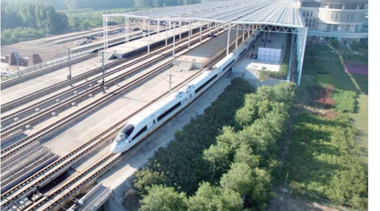
2016年5月16日晨，德州东至北京南高铁列车驶入“德州号”（G8935/6次）自德州始发。