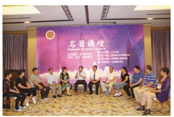
△专家与嘉宾互动交流

5月21日,由大众日报主办、修正药业协办、齐鲁酒地承办的第5期“名医讲坛”在齐鲁酒地成功举办。