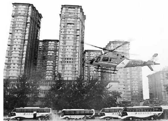
本月开始，这架直升机就将常驻山东省中医院东院区，开展医疗救援服务。(资料片)

□记者 李振 通讯员 潘月丽 报道 本报济南讯 6月2日下午，随着一架红色直升机缓缓降落在山东省中医院东院区停机坪，金汇救援“空中120”救援直升机入驻济南，标志着省城拥有了一架常驻本地的医疗救援直升机，将为城区及周边县市居民提供空中“黄金一小时”医疗救援服务。