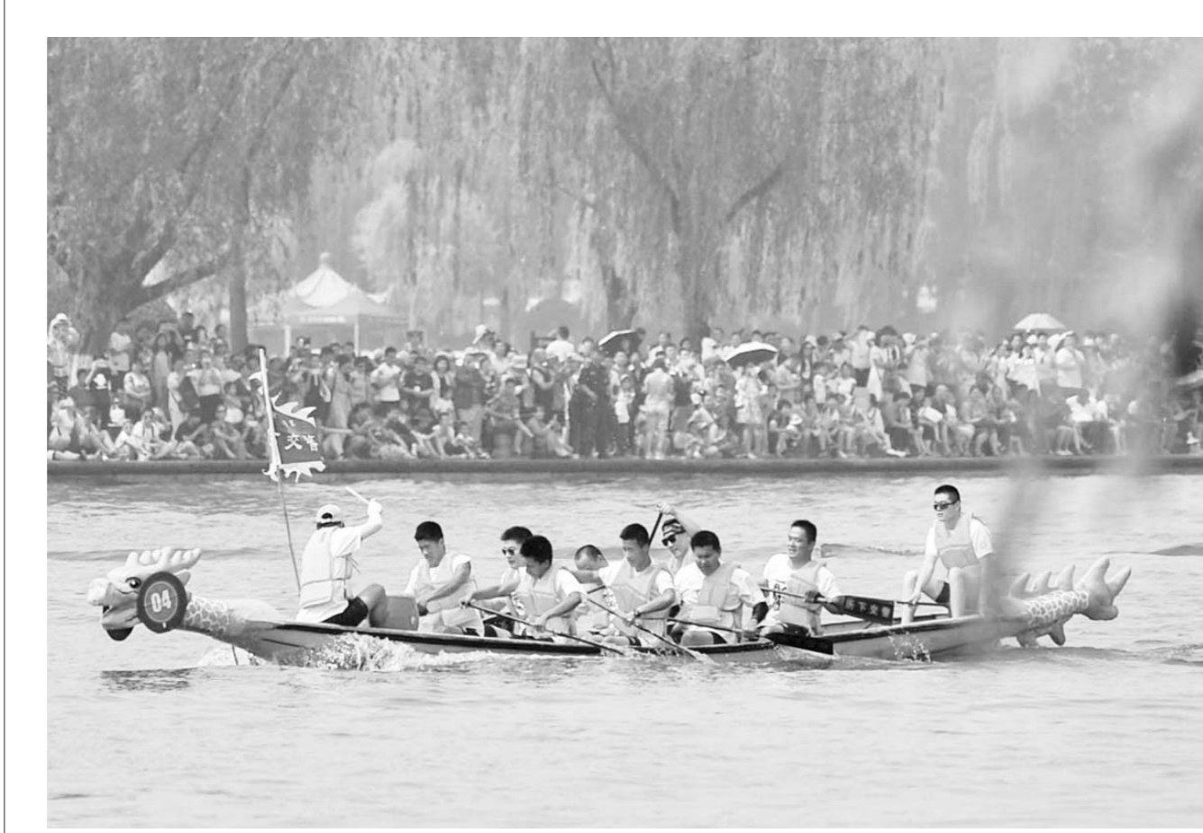
□记者 房贤刚 报道 5月30日端午节，济南天下第一泉第五届端午节龙舟赛在大明湖开赛。来自法国的翼翔玫瑰龙舟队和11支国内队伍参加了当日的比赛。

为深入落实全省品牌战略，培育山东百年品牌，省经济和信委委员会将于6月21日举办“2017山东首届百年品牌论坛暨中国工业品牌之旅山东站”活动，本次活动还将邀请国内顶级品牌专家举办我省首届“品牌大讲堂”。 本次论坛以“树高端品牌，创百年企业”为主题，通过举行中国工业品牌之旅山东启动仪式等多个具体活动，为企业搭建讲述山东制造“品牌故事”的舞台。(□陈昕路 报道)