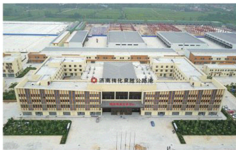
△济南转化泉胜公路港

黄河北，将突出产城融合。当地将加快培育产业，依托新材料、现代物流等产业基础，对接济南新区规划，明确功能定位和产业布局，努力打造先进制造、现代物流、休闲康养基地；同时积极推进金融、物流、信息、污水处理、标准厂房等生产服务设施建设，加快推进教育、医疗、文化、体育、保障性住房等生活服务设施建设。该区将突出“一园一湖”，形成拉动产城融合、加快赶超发展的隆起高地。其中，鹤山龙湖片区基本建成国际生态新城，成为携河发展的新地标；济南新材料产业园区基本建成国家级开发区，积极融入济南构建开放型经济新体制综合试点，打造对外开放高地。