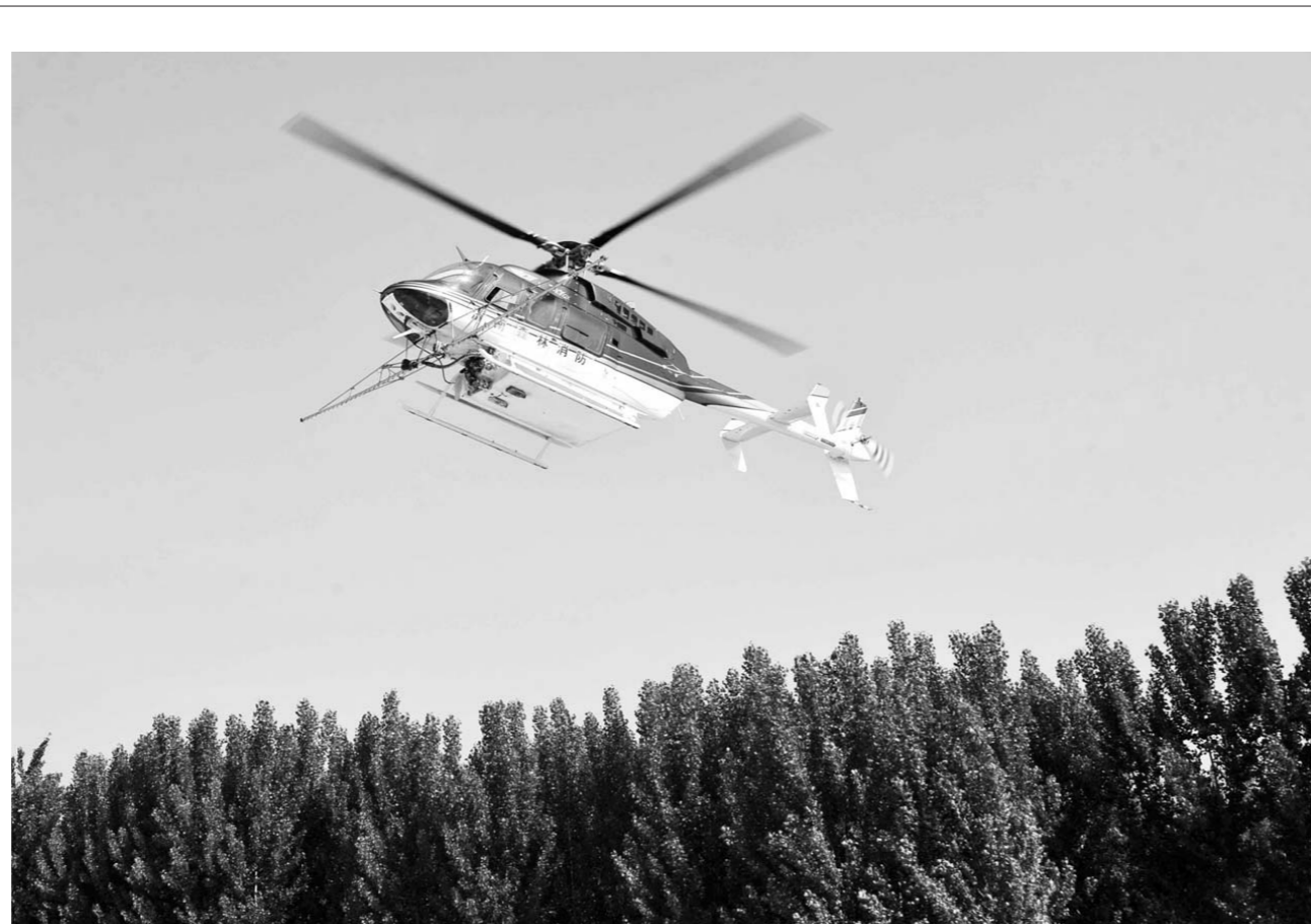
□记者 王世翔 通讯员 赵玉国 报道 近日, 飞防直升机在对莒平县30余万亩林木“喷洒生物制剂, 防治美国白蛾。美国白蛾是一种世界性检疫有害生物, 食性杂、繁殖力强、传播途径广, 有“森林蝗虫”的恶名, 被列入我国外来入侵物种。5月中下旬是美国白蛾第一代幼虫孵化盛期, 也是防治的关键时期。当地抢抓时机, 科学、环保地防治美国白蛾。

2016年,胜利石油工程首次涉足土耳其地热井项目,圆满完成了4口地热测试井,其中,3口井实现了工业价值,在业内积累了丰富的行业口碑,深得业主的信赖。(□徐永国 王维东 报道)