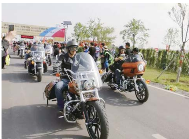
法国PBP 全称:巴黎Paris—布雷斯特Brester—巴黎Paris

法国PBP真的来了! 5月13日,法国PBP 2017年中国赛区1200公里挑战赛“齐鲁酒地杯”安丘200公里不间断骑行选拔赛正式开始!