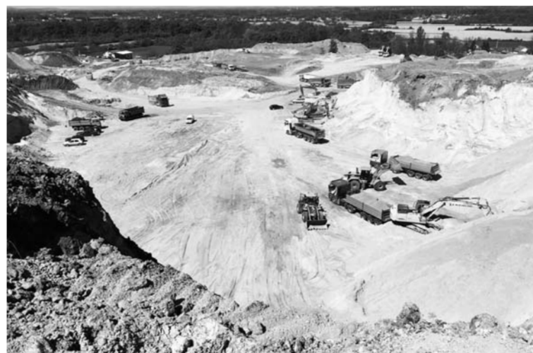
△山东高速集团承建的塞尔维亚E763高速公路施工现场