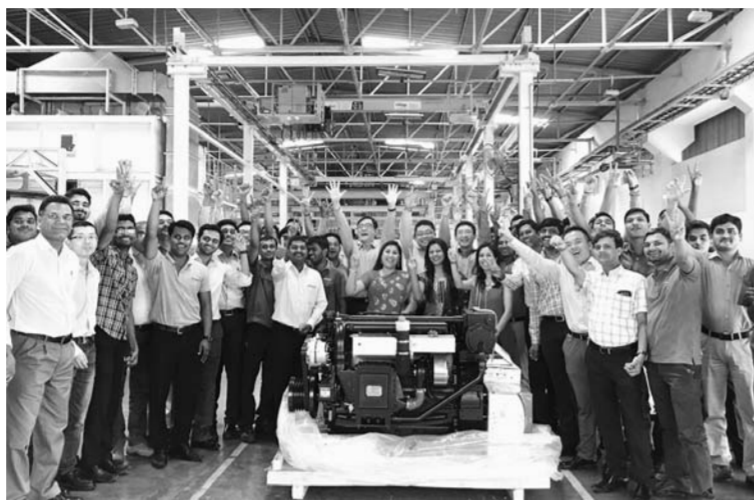
△2016年3月，潍柴在印度制造的发动机首次出口国外

近日，笔者从省国资委了解到，截至2016年年底，全省已有6户省管企业参与或投资“一带一路”建设，与国家企业合作的20个在建项目涵盖基础设施、产能合作、能源资源等领域，进展和成果均良好。“今年会有一系列政策与服务进一步落实。”省国资委相关负责人透露，这将带动更多鲁企“担当”的产业项目在“一带一路”沿线落地开花。