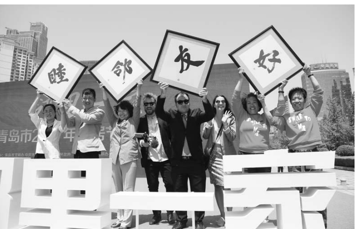
□记者 薄克国 报道

□记者 吴荣欣 陈明 报道 本报东营讯 日前，齐鲁交通服务开发有限公司并购东营联合石化有限责任公司项目增资扩股签约仪式在东营举行。东营联合石化有限责任公司是一家大型炼化一体化企业。公司二期将增加加氢裂化和石脑油催化重整等配套装置，优化技术加工路线，提高设备产出效率，投产后预计可实现年营业收入230亿元。齐鲁交通服务开发有限公司通过增资入股方式取得东营联合石化40%股权，成为第一大股东。本次并购有利于整合齐鲁交通能源类资产，依托集团网资源优势，拓展燃油产销产业链，提高运营效率和效益。