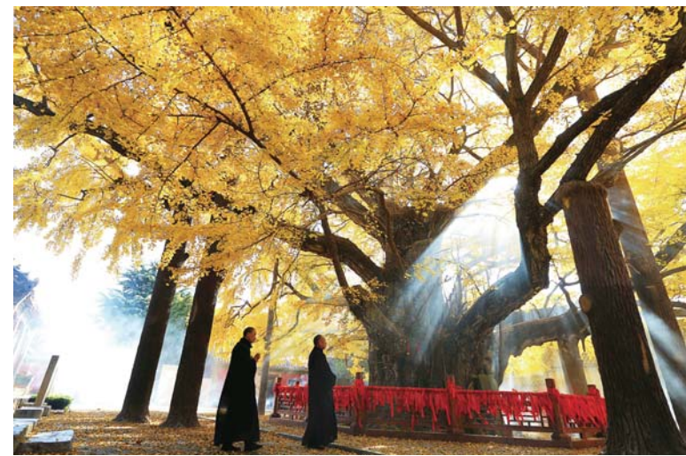
△日照莒县浮来山上，4000多年树龄的银杏久经沧桑仍然枝繁叶茂