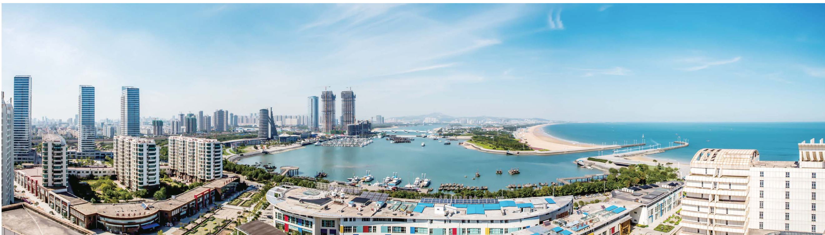
△奥林匹克水上公园，体验水上运动之趣

容丰富的“旅游大礼包”，全部免费发放 有印刷精美、便于携带的“码上日照”旅游地图，让你出行更加方便；有详细介绍日照各景点的旅游攻略，让你轻松玩转日照；更有万平口景区、海之秀演出、海洋公园、水沙秀演出等一系列日照著名景区的门票优惠券，让你省钱又省心。 此外，还有美味的日照海鲜、醇香的日照绿茶等多种地道的日照美食等你来品尝…… 试想一下，当你站在海边，感受着和煦的阳光照射身体，极目远眺，一望无际的大海波光粼粼；闭上眼睛，微风拂过脸颊，心情像风一样自由；你光脚踩在松软沙滩上，一瞬间，从脚底涌起的那种松软与温暖让你全身通泰；你踏入水中与大海相拥，一扫夏日的炎热，带来透心的清凉，轻松愉悦自不必言。 阳光海岸，度假天堂，日照正以热情、开放、包容的姿态欢迎着每一位游客到来。