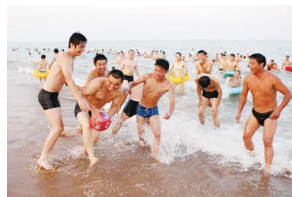
△日照金沙滩海水浴场，畅享夏日海滨之乐

常言道“百闻不如一见，一见不如体验”。近日，在济南泉城广场举办的日照旅游风光摄影展，让广大游客一睹日照大海的极致美景。一张张靓丽的照片，记录着日照旖旎的自然风光、讲述着日照淳朴的风土人情、诉说着日照深厚的文化底蕴。 然而，单用眼睛并不足以感受大海的波澜壮阔，既听不到浪涛拍打礁石奏出的交响，也呼吸不到来自海上的清新空气。要想真正领略大海的风采，还得亲自到日照的海边走一走。 据说每一个深居内陆城市的人，心中都有一个拥抱大海的梦。那么问题来了，拥有大海的城市那么多，为什么要去日照？ 理由一：交通便利，从泉城45分钟直达日照 目前，济南往返日照的航班已经开通，从济南遥墙机场乘坐飞机45分钟即可落地日照山河机场。此外，山河机场现已开通北京、上海、广州、深圳、成都、重庆、西安、天津、厦门、大连、哈尔滨、沈阳、太原、杭州等多条国内