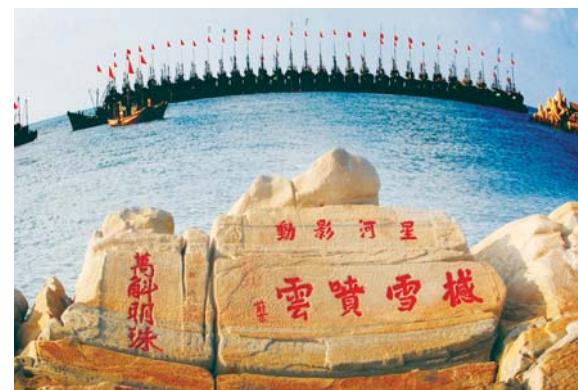
△日照岚山“海上碑”是目前中国唯一一块古人在海边礁石上的石刻作品，涨潮时没入大海，退潮时兀立于海滩，其始刻于清顺治乙酉年间(1645年)