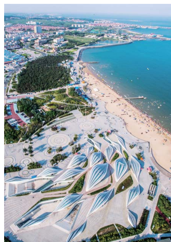
△梦幻海滩建筑造型奇特，如鱼游大海