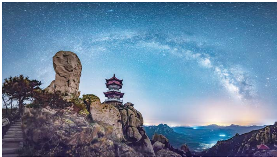
△九仙山上，情侣峰下，何必花前月下