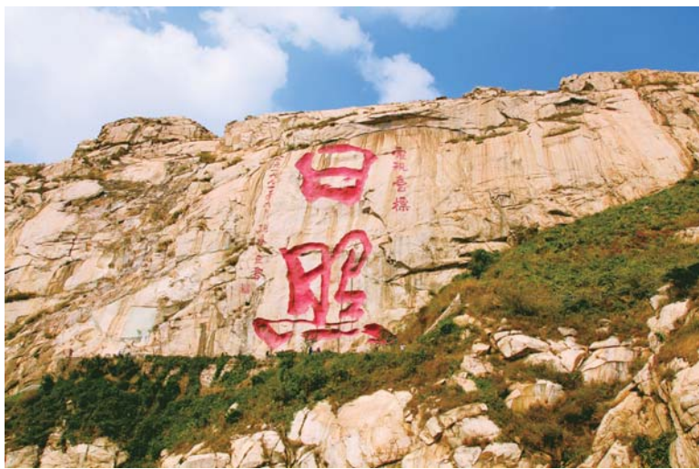
△在日照河山主峰西南侧，有巨书“日照”刻于悬崖之上，“日”字高20米、宽17.5米，“照”字高25米、宽25.5米，是汉字摩崖石刻的世界之最，被载入世界吉尼斯大全