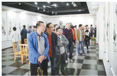
4月28日，“海曲大工匠”写生采风创作展在日照市文化馆开幕，30多件反映传统手工艺者劳动场面的国画作品集中亮相，在“五一”劳动节期间向市民开放。

今年是日照市土地储备开发集团创业发展的第二年，也是集团各项事业快速发展、全面提升的关键之年。集团号召全体干部职工甩开膀子迈开步子，以崭新的精神风貌投入“百日奋战”，确保取得丰硕战果。