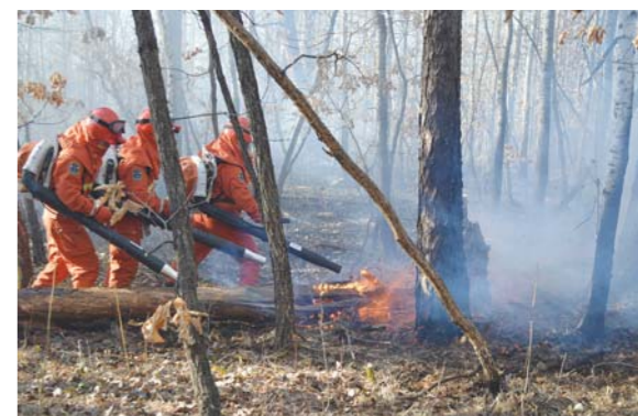
5月1日,武警内蒙古大兴安岭森林支队官兵在扑救森林火灾。

耿爽说,中方注意到峰会主席声明关于南海问题的表述。当前,在地区国家的共同努力下,南海形势降温趋缓,呈现积极发展态势。中方愿与东盟国家一道,共同落实好《南海各方行为宣言》,深化海上务实合作,争取在协商一致基础上早日达成“南海行为准则”,共同维护南海和平稳定。按工作计划,今年上半年中国和东盟国家将完成“准则”框架草案的磋商。