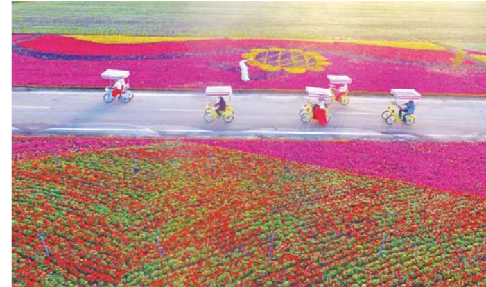
□ 记者 李勇 通讯员 启民 报道 五一假日,游人骑着车徜徉在台儿庄古城景区花海之中。

□ 记者 刘兵 李子路 通讯员 王海波 报道 本报济南5月1日讯 “五一”小长假期间,我省各地策划了丰富多彩旅游产品和活动,形成旅游消费新高潮。省旅游发展委发布的信息显示,假日期间,纳入全省重点监测的150家景区共接待游客712.6万人次,同比增长13.9%。门票收入4.3亿元,同比增长15.7%。 据了解,以“全域联合、全业联动、全年联结、全民联欢”为主线,我省开展的“山东好时节”系列旅游活动,在“五一”期间形成好戏连台、高潮迭起的十大文化旅游目的地品牌效应。 此外,各大景区不断丰富和完善旅游产品,优化环境服务,吸引力进一步增强。据了解,假日期间全省11家5A级景区接待游客超过150万人次,增长12%,济南市全免费开放的大明湖景区接待量达到去年同期的4倍。 交通方面,由于“五一”假期正值旅游旺季,省内高速公路旅游客运、自驾游车辆大幅增加,特别是部分通往旅游景点的热点线路和主要交通节点出现流量井喷,京沪、青银、荣乌、青兰等干线高速公路日最高流量逼近15万辆次,是平时的3倍,荣乌高速公路峰值达到18万辆次。面对车流量持续高位运行的严峻考验,全省各级高速公路交警部门强化信息预警监测,严格路面巡逻管控,坚持事故快处快赔,全力以赴确保人民群众通行高速公路安全。据统计,节假日期间全省各级高速公路交警部门共出动警力4540人次,警车1738辆次,检查重点车辆1.32万辆次,查处超速、超员、非法占用应急车道等交通违法行为6915起。