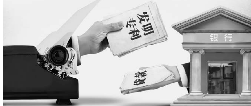
资料 王亚楠 制图：于海员

近年来，我省700余家企业通过拥有的专利权等为质押获得金融机构贷款总金额超过220亿元，其中九成以上是中小微企业。