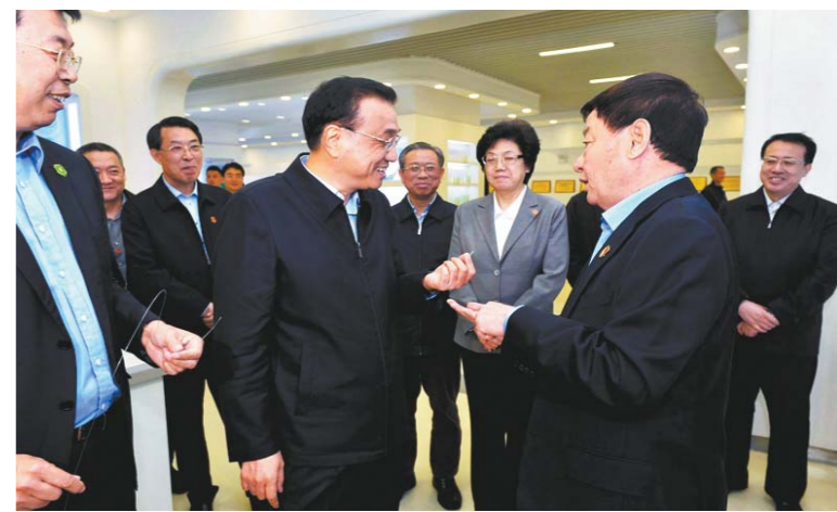
4月19日, 李克强考察威高集团。