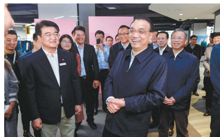
4月20日, 李克强考察威海迪尚集团。