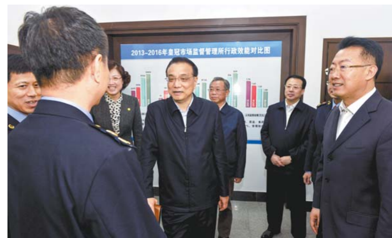
4月20日, 李克强考察威海皇冠市场监管所。