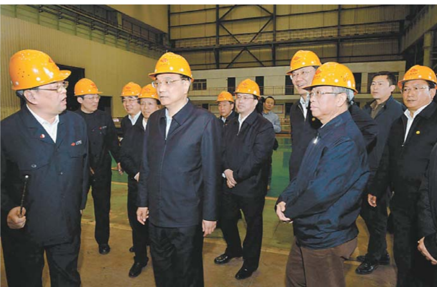
4月20日, 李克强考察济钢集团。