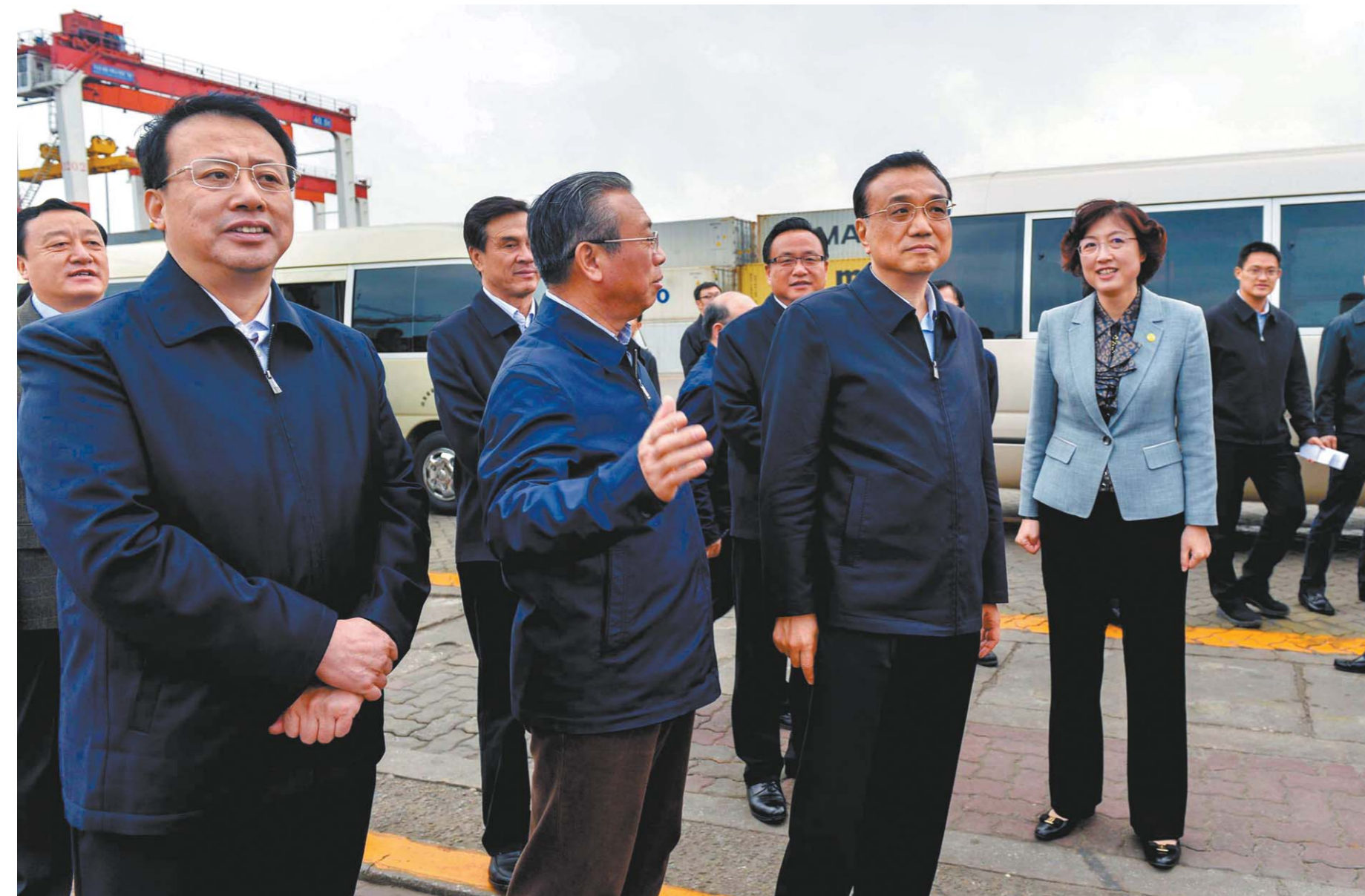
4月19日, 李克强总理在省委书记刘家义和省委副书记、代省长龚正等陪同下考察威海港。