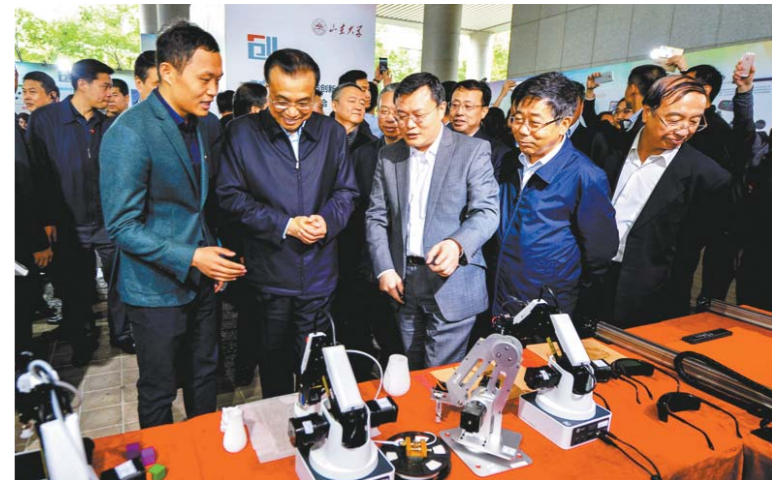
4月21日, 李克强考察山东大学就业、创业、创新成果展。