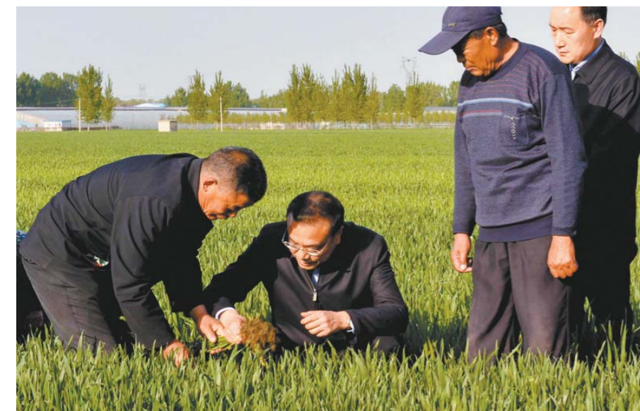
4月20日, 李克强来到济南市历城区曲家村一处麦田查看小麦生长情况。