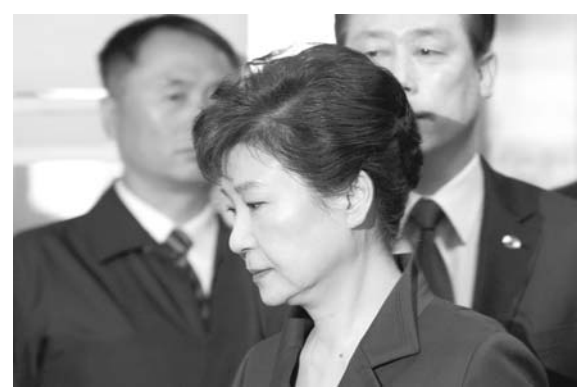
△韩国检方17日决定以18项罪名起诉前总统朴槿惠，这是3月30日朴槿惠到达法院的资料照片。