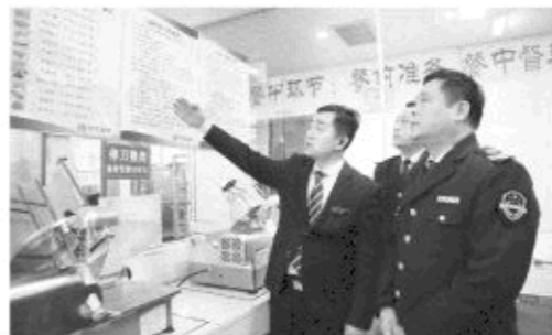
△章丘区食药监局党委书记、局长鲁德刚(右)在区某餐饮单位检查食品安全制度

关法律法规。有了“硬杠杠”，再加上严格的监管，以及第三方管理公司的介入，形成了这里的一种“摊贩文明”。 在小餐治理方面，我们突出上门督导培训、严查、勤查相结合，渐渐地小餐饮经营者“约定俗成”，由“你管我”到“自管自”，形成了一个让消费者放心的“小餐饮群”。 “硬”“软”加“革命” 探索监管新路径