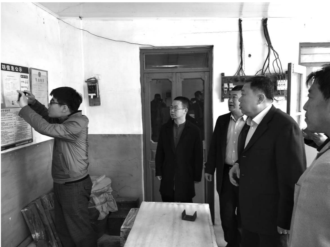
为推动国家食品安全示范城市创建，日前，省食药监局组织人员到我省创建市进行调研。图为调研人员在招远市辛庄镇“水盘芝麻糖”小作坊加工园区，就园区建设、原辅材料进货查验、生产过程控制、产品检验以及监督管理等进行调研。 □杨润勤 张勇 报道

□杨润勤 栾振兴 报道 本报济南讯 日前记者从省食药监局获悉，今年我省将建立覆盖全省、分工合理、权责明确、四级联动的食品安全抽检监测和预警机制，重点抽检安全风险高的产品。 据介绍，抽检坚持以问题为导向，以重点区域、重点品种、重点项目为核心目标，侧重抽检安全风险高、日常消费量、社会反映强烈、易受环境影响和需要一定储藏条件的产品。各级靶向抽检各有侧重，市县级监管部门抽检监测的重点是食用农产品、中小企业产品、流通企业产品和餐饮食品。省、市、县三级抽检要实现获生产许可证的在产企业全省覆盖。采样环节以流通环节为主，生产环节为辅；流通环节采样要涵盖批发市场、农贸市场等新业态；餐饮环节采样重点为学校及托幼机构食堂以及中央厨房等。 对不合格(问题)产品建立核查处置台账。发现多少批不合格产品，上级监管部门安排下来多少批抽检产品、处理到哪个环节，什么时候应该结案，什么时候需要上报、公布核查处置结果，都要做到台账清楚。