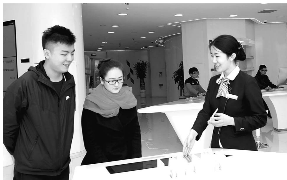
□ 陈东林 报道

尽管位于闹市,走进这家网点,却看不到传统银行繁忙的景象。入口处首先设置了“智能导览台”,通过3D地图导览,记者了解到整个网点共分为两层,一层设置了客户引导区、信息发布中心、理财服务区、对公业务区、自助银行区、休闲等待区等9大区域,二层配有理财中心、个人贷款中心和国际金融中心。与传统网点不同的是,大厅