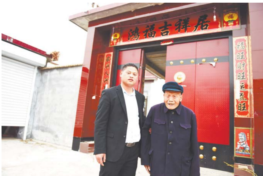
□记者 吕光社 报道

但没过几天,村里的一堂乡村儒学课,让单勇心里打起了鼓。那堂课讲孝道,老师是从省城来的教授,讲的是“子路百里负米孝亲”“子欲养而亲不待”的故事。“爷爷奶奶老体弱,住的土坯房也破烂不堪,父母的身体也远不如当年,还有一个孤单的二爷爷自己过,如今弟弟搬进城,我如果也走了,谁来照顾五位老人?现