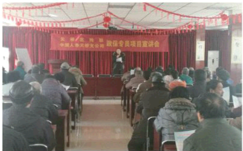
△承保专员项目宣讲会