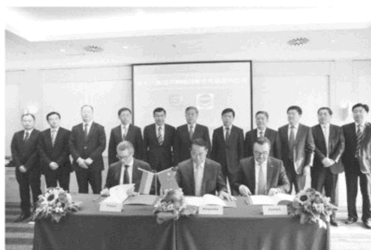
△金正大收购康朴公司交割仪式

从荷兰EKOMPANY到德国康朴，再到西班牙Navassa，一个个并购案例证明，金正大依靠自己的技术实力，把别人食之无味的“鸡肋”变成了“鸡大腿”，把别人啃不下的硬骨头啃了下来，由此赢得了国际知名企业的尊重，赢得了所在国的广泛赞誉，同时也叫响了“金正大”的品牌，为未来国际业务合作与发