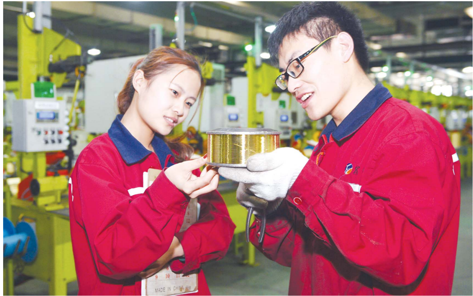
□ 记者 卢鹏 通讯员 赵真 报道

该县依托传统纸业技术优势，以国家级技术研发中心为引领，坚持创新驱动，加大科研投入，重点形成了高型纸、热敏纸、无碳复写纸等高附加值特种纸加工生产及相关装备制造的产业链，产品远销东南亚、欧美等多个国家和地区。