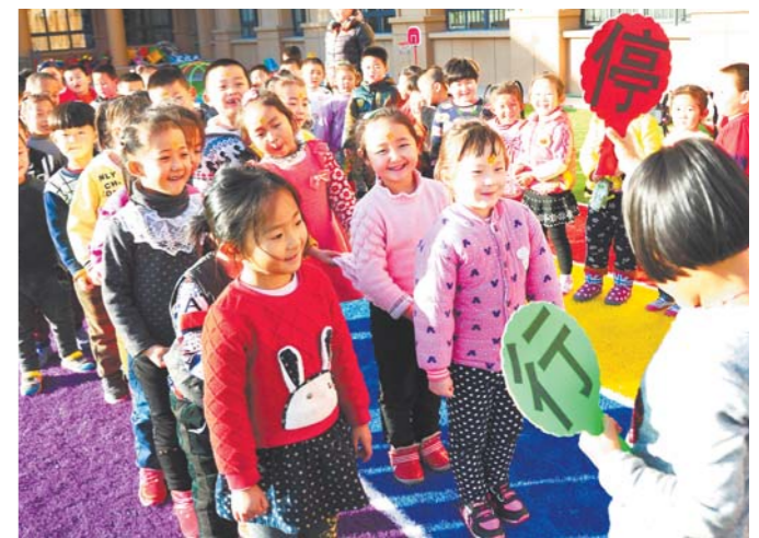
烟台一处幼儿园的小朋友们在认真学习安全过马路。