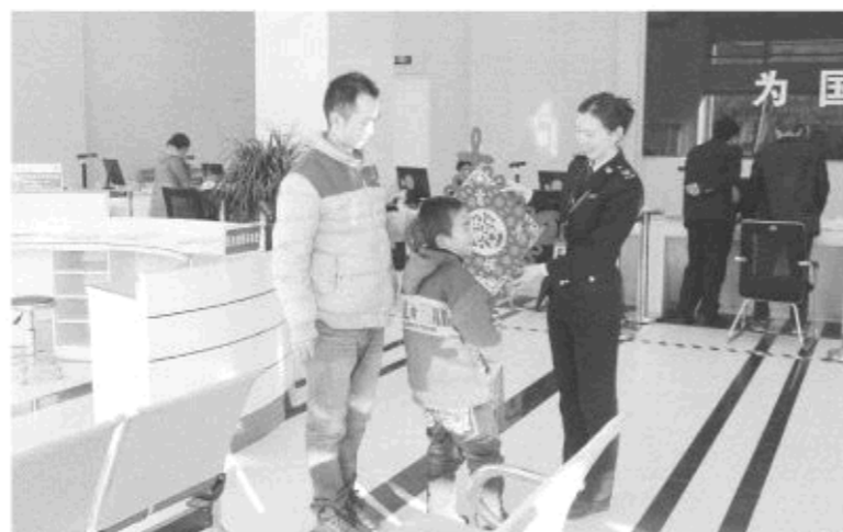
△上门服务获纳税人称赞

集“富强福”, “便民”系统全新升级——2016年是“新金税三期”优化版系统、山东省地方税务局网上申报系统和扣缴个人所得税系统等税务新系统全面升级和推广使用的一年。这些全新的税务系统, 使网上申报更加精准化、专门化, 也让纳税人自行申报流程更加专业化。系统的全新升级, 不仅是新时期税