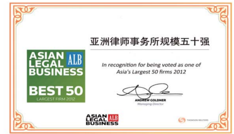
△众成清泰律师事务所位列亚洲律所规模五十强