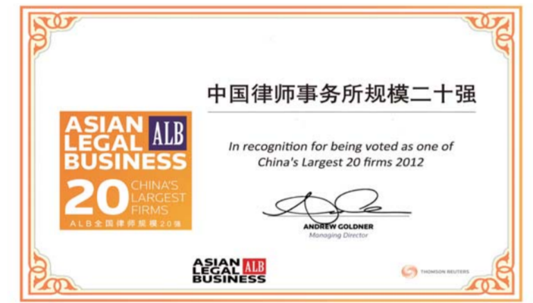
△众成清泰律师事务所位列中国律所规模二十强