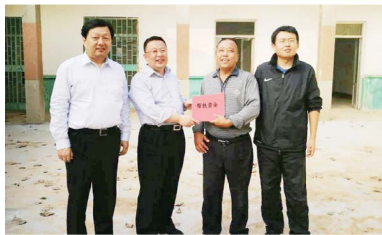
△众成清泰律师事务所精准扶贫——对口帮扶马山镇关王庙村