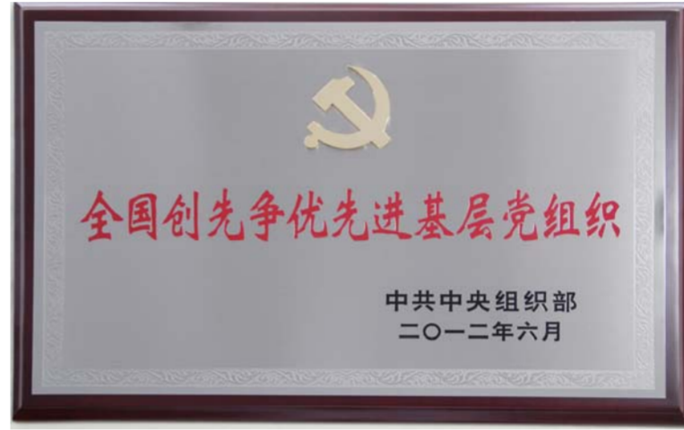
△全国创先争优先进基层党组织