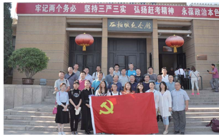
△党员律师赴西柏坡接受革命传统教育