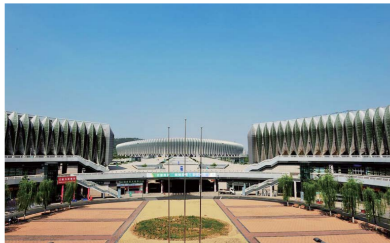
△众成清泰律师事务所为济南奥体中心场馆建设提供法律服务