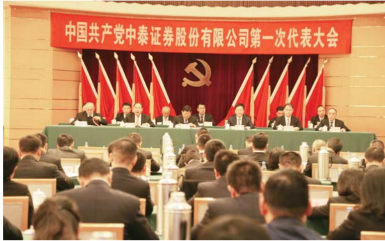
△2016年12月28日，中共中泰证券股份有限公司第一次代表大会召开

平；2016年纳税37.51亿元，近三年累计达到97.3亿元；投行完成融资近700亿元，实现历史性突破；新三板推荐挂牌、做市企业数量分别位居行业第3位、第2位……作为唯一一家注册地在山东的全国大型综合类券商，近年来，中泰证券深化改革，积极作为，整合自身资源和各方优势，倾力助推山东实体经济发展。