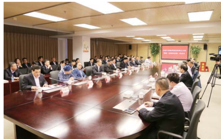
△2016年11月28日，山东中泰慈善基金会召开成立大会