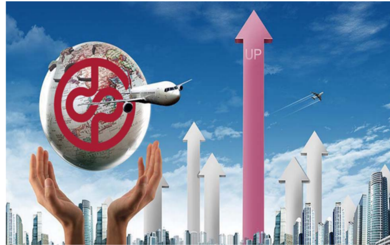
△2016年中泰证券各项业务创历史次高水平

步走。自主研发推出APP移动平台、首创的ICC（互联网呼叫中心）+滴滴抢单模式，形成O2O客户服务体系；上线微店业务，让客户在移动端享受中泰投资顾问的个性化产品推荐和购买，构建O2O投顾服务体系。