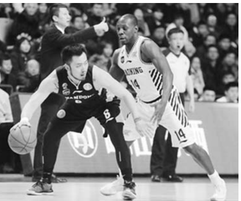
▲高速男篮打辽宁队，全场出现20次失误。