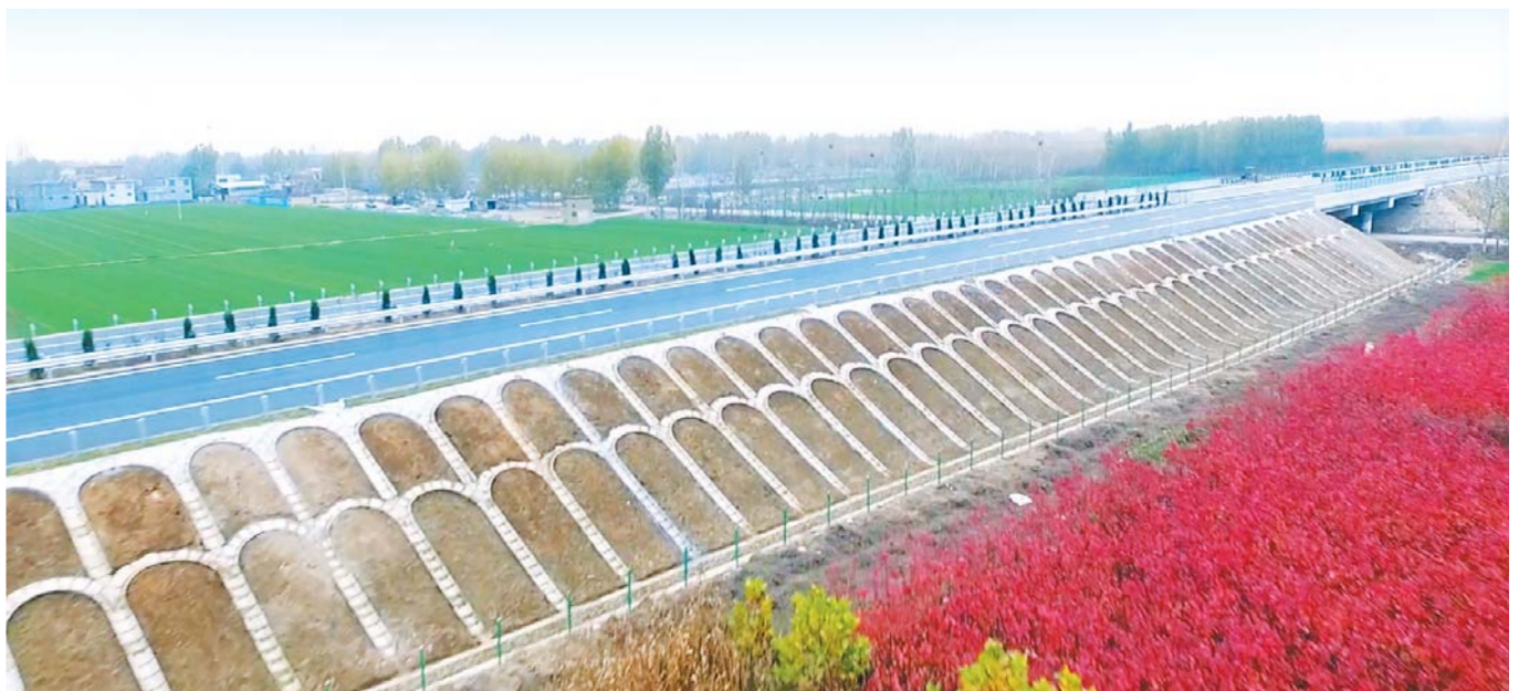
△2016年底建成通车的济南至徐州高速公路济宁至鱼台段