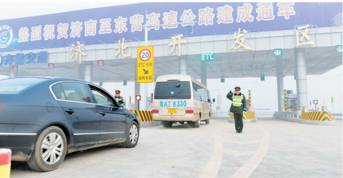
△2016年底建成通车的济南至东营高速公路

打好交通建设攻坚战。加快建设大路网。继续推动高速公路建设提速，围绕建设东西南北大通道、省际高速通道，全面加快泰安至东阿、东阿至鲁冀界等20个、1962公里续建项目进度，年底力争济日高速滨海连接线、东明黄河大桥及连接线、蓬莱至栖霞等3个项目、90公里建成通车。加大前期工作力度，积极作为、提早动手，全面启动“十三五”规划中计划建成项目前期工作，确保莱荣至泰安、董家口至五莲等11条、642公里高速公路年底前开工建设。进一步优化普通干线路网布局，继续加强普通国道升级改造，打通断头路，畅通拥堵堵点，重点实施瓶颈路、穿城路段新建改建1500多公里，完成长清、济齐2座黄河公路大桥建设，提升干线路网整体服务功能。加快建设大港航，年内确保青岛港前湾港区迪拜环球码头等8个项目建成投产，扎实推进韩庄、万年复线