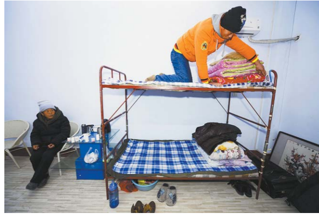
为了方便照顾母亲，娘俩就上下铺住着。