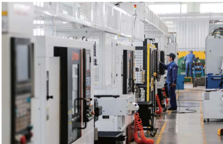
△国家高新技术企业锐博科技生产线