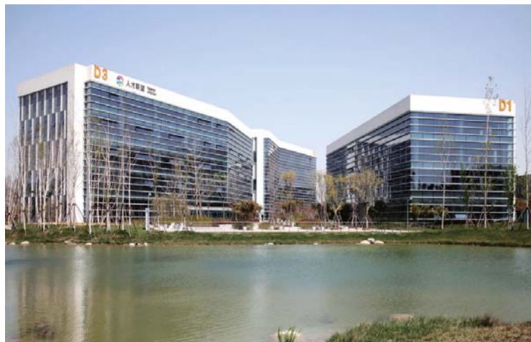
△山东省首家人才联盟