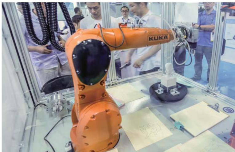
△区内研发机构—中科院先进院研发的机器臂演示功能