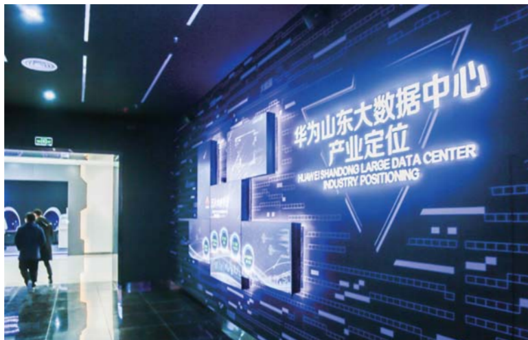
△山东省信息技术产业基地展示中心

在工业经济领域，济宁高新区构建了智慧环保平台，利用数字化城市管理平台，把网格化管理与数字化监控结合起来进行调度、指挥和监督，大气污染防治实现智慧化管理。污水处理厂、混凝土搅拌站、渣土运输、煤场堆场和重点危废企业，以在线视频监控的方式对接至高新区数字化平台的管理当中，济宁市环境监测监控信息管理系统的全时在线监测数据，也以链接的形式对