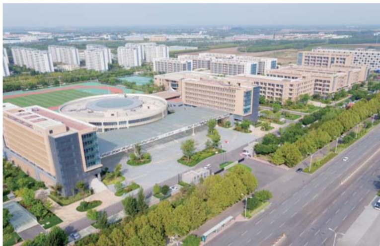
△国家高新区大学园