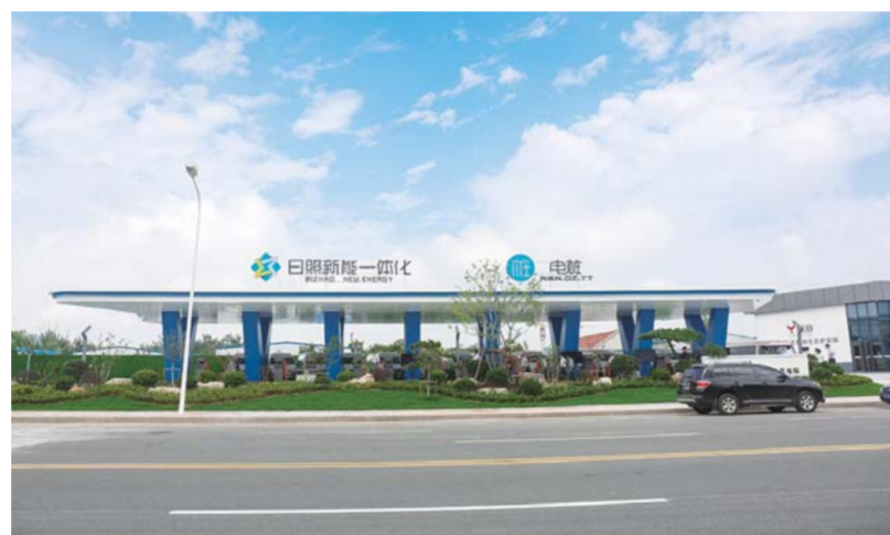
△睿航新能一体化充电站