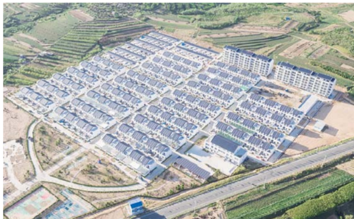
△东港区南湖镇实施的弓山村城乡建设用地增减挂钩项目

土地储备开发集团瞄准地理信息测绘、新能源等新兴朝阳产业，积极拓展新的业务板块，推动集团多元发展。