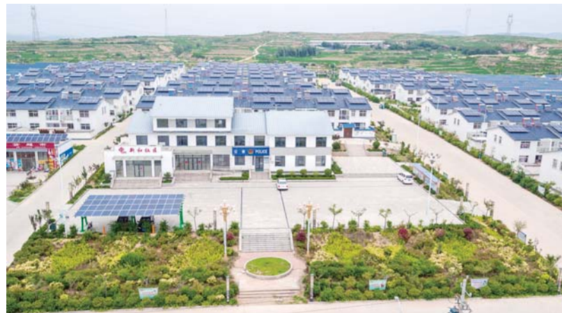
△东港区陈疃镇新和社区光伏发电项目