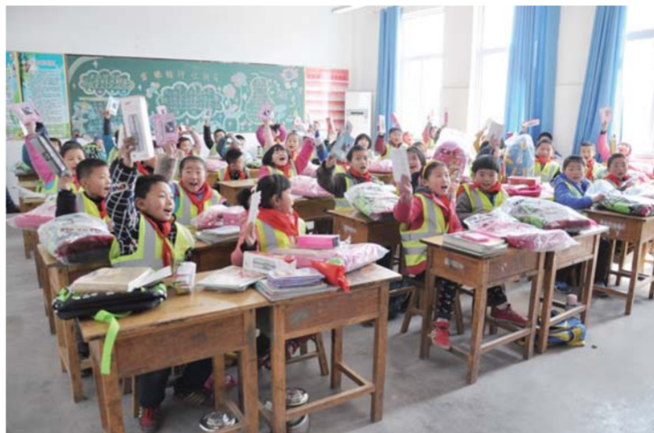
△走进贫困山区为小学生献爱心